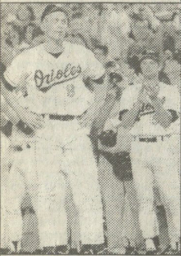
როგორც ჟეიმარტ რეკორდსმენს შეშუენის, რიკენი კლაკატ კვლას ხილავს თაქმდაბლობით

ამ წლის შემდეგ ლიგას 32 ქულით (8 მოვებით) ლიდერობდნენ ჩრდილოეთი მელბურნის „კენგურუები“ და მელბურნიისავე იტალიური უმისი — კარლტონის „ლურავები“. სეზონი სექტემბრის ბოლოსდა დასრულდება პლი-ოფითა და დიდი ფინალით.