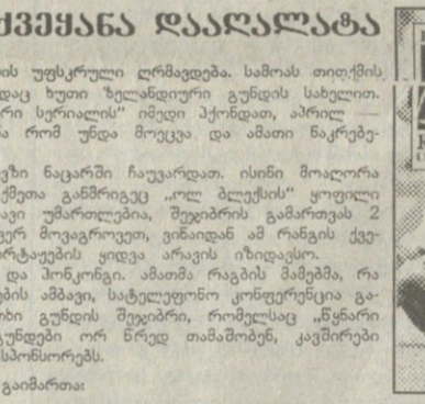
განსაზრებულად სწავლობს და მთავრად მატჩებს მივლიან

ამ შეჯიბრში დღემდე შემდეგი მატჩები გამართა: 11.V. აშშ — კანადა 19:12, იაპონია — პონკონგი 34:27, 18.V. კანადა — აშშ 24:20, პონკონგი — იაპონია 33:9, 1.VI. პონკონგი — კანადა 12:18; 9.VI. იაპონია — კანადა 18:45, პონკონგი — აშშ 22:19