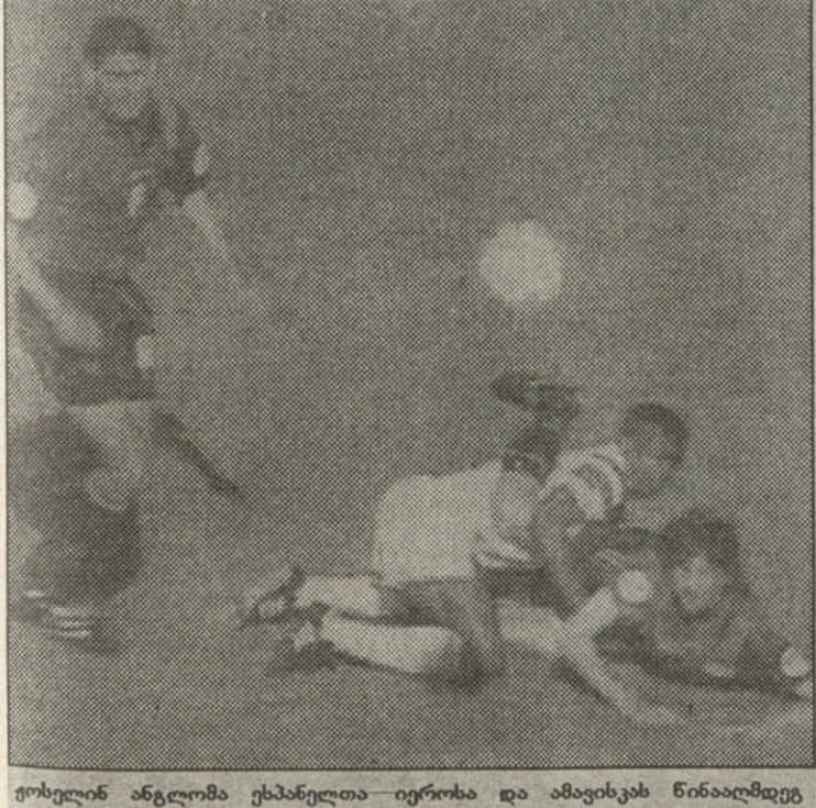
ფოსტელინ ანგლომა ესპანელთა იეროსა და ამავეისკას წინააღმდეგ

— მერაბ ჟორდანიაც იმასვე ფიქრობს, რასაც მე და ეს უთხრა კიდევ ანდროსონს, ლის და სხვებს სხვაგვარად არ შეიძლება „სიტი“ რომ არ გაკარდნილიყო, ალბათ ადრეც ექნებოდა აზრი ჩემს სხვაგვარად ვადასვლაზე საუბარს, მაგრამ, კიდევ ვიმორბე, მე პრემიერლიგაში ვითამაშებ... — რამდენად მართალია ცნობა, ლი იმ კლუბს ჩაუდგება სათავეში, სადაც ქინქლაძე ითამაშებს? — ვერ გეტყვი, მაგრამ ფაქტია, რომ ლის იმაზე მეტად ეუფარვარ, ვიდრე პრეზიდენტს შეიძლება ფეხბურთელი უეფარდეს. ადრეც ხშირად მითქვამს შენთვის, რომ „სიტი“ მიელს ინგლისში გამორჩეული, ოჯახივით კლუბია. ლი კი ამ მხრივ ამათუ ინგლისელებში, ქართველებს კი გამოიჩინევა რადაც საოცრად, ლამისაა შეიღებზე მეტად ეუფარვარ. მისი მოქმედება, ვერძინა, მარტო პირად კეთილდღეობას არ ემყარება, ადრე მითხრა, სხვაგვარად რომ ვადასვდე მანც მსურს შენს მომავალ ბედობაში ჩემი წყლილი შევიტანიო. ჩემთვის მეტად უცნაური და ამაღლეულებია უცხოელისგან მსგავსი საქციელი... — მოკლედ, ესა: სად დავიწყებ სეზონს, ამას ამჟამად მნიშვნელობა არა აქვს, მე პრემიერლიგაში უნდა ვითამაშო.