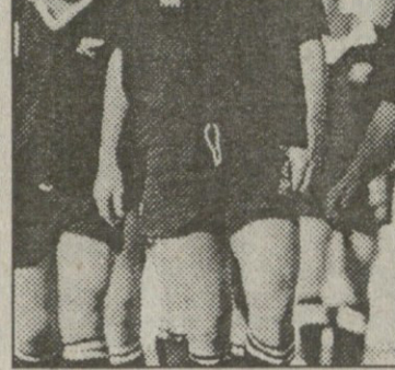
ზულანდია მოტლანდია (17) 36-12 (7)

უიმბლდონში უპირველესი ქალი ფავორიტი შარმანდელი ჩემპიონი, გერმანელი შტეფი გრაფი...