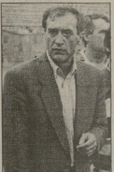
ეს კი არა, გუნდი თუ იქნება, საკი თხავია...

— ისევე „მეტალურგს“ დავუბრუ-ნდით. ამბობენ, უპატრონოდ რჩებათ,