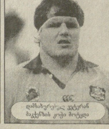
დამსახურებულ კეტერან მაქქენის კოჭი მოტყდა