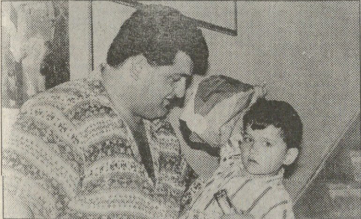
განდები მაშკო ჩემპიონი? დავით ხახალიშვილი ვაჟთან ერთად

ტული სულისკვეთებით ვიბრძობებთ სპორტის საიდებლად და ჩვენი გუნდის ღირსების დასაცავად — სამშაბათს საქართველოს ეროვნული ოლიმპიური კომიტეტის მუზეუმში ასე დაიფიცა ყვარულმა ძიუდოსტმა გიორგი წმინდაშვილმა, ოლიმპიურმა ჩემპიონმა მედეა ჯულემმა სხვა ვეტერანი ოლიმპიური ჩემპიონებისა და პრიზიორების სახელითაც ატლანტაში სააპეროდ წამსვლელთ კი ამ სიტყვებით დაულოცა გზა: „ოლიმპიურ თამაშებში მონაწილეობა თავისთავად დიდი წარმატება და დიდი ბედნიერებაა სპორტსმენისათვის, თქვენ კი ორმაგად ბედნიერები ხართ, რადგან ოლიმპიადეზე საქართველოს სახელით გამოიხვალთ, ჩვენი სამშობლოს ღირსებას დაცავთ. უფროსი თაობის ოლიმპიელებიც გარკვეულწილად საქართველოს ღირსებას ვიცავით — მაშინ საბჭოთა კავშირის ნაკრებში საქართველოს წარმომადგენლები ვყოფით, მაგრამ ეს მსოფლიოში არაფერი იცოდა და აუხდენელ ნატვრად დაგვრჩა სა-