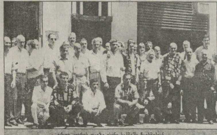
ერთი კვირის თავზე ისინი საქმეში ჩაებებინან