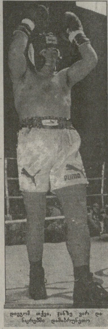
დიდგომ თქვა, ჯანზე ვარ და ნაკრებში დამატარუნეთო