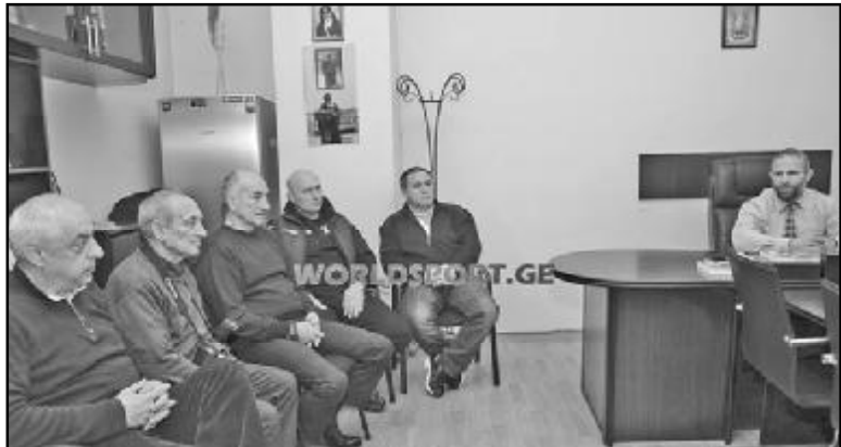
ნენ, ოლონდ მთავარი მწვრთნელის გარეშე.

და, ფინეთში გამართულმა ევროპის პირველობამ გამოაჩინა, რომ საქართველოს ნაკრებებს გაცილებით დიდი პოტენციალი აქვთ. „დარწმუნებული ვარ, ოლიმპიურ თამაშებზე ჩვენი მოჭიდავეები საქართველოს ღირსეულად წარმოაჩენენ. ევროპის ჩემპიონატზე ნაჩვენები შედეგი რომ მაქსიმუმში არაა, მგონი, ამაში ყველა დამეთანხმება. უდიდესი რეზერვი არსებობს და მის გამოსაყენებ-