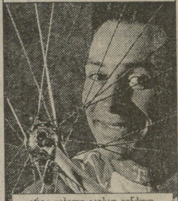
ერიკ ცახელი გაისად ვინღა „დოიჩე ტელეკომის“ ლიდერად მოკვევლინოს

საფრანგეთის ველოტურნი გამარჯვებულ დანიელ ბიარსე რიოსა და მის თანაგუნდელებს — „დოიჩე ტელეკომის“ მხრილობს გულითადი მხვებდრა „მოუწყვეს არემ“ მაგრამ რე გამარჯვებულზე მეტი პატივი მოკეს სწორედ იამ ულარეს, იამში მერე ადგილზე რომ გავიდა, იმასაც იამიომე, იამად „ტელეკომის“ ლიდერი რიოსი, კარა იქნება, არამედ ულარისი, თუმცე არც ურთკ ცახელის დაიხატება ეგებოს, ერთობ ძლიერი სპინტერი რომაა.