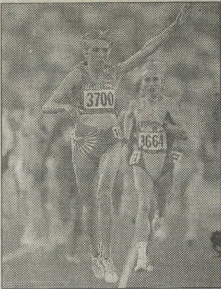
რუსმა მასტეროვამ 800 მეტრზე მეტოლასი და კირიტის ჯონის შემდეგ 1500 მეტრზე გაიმარჯვა