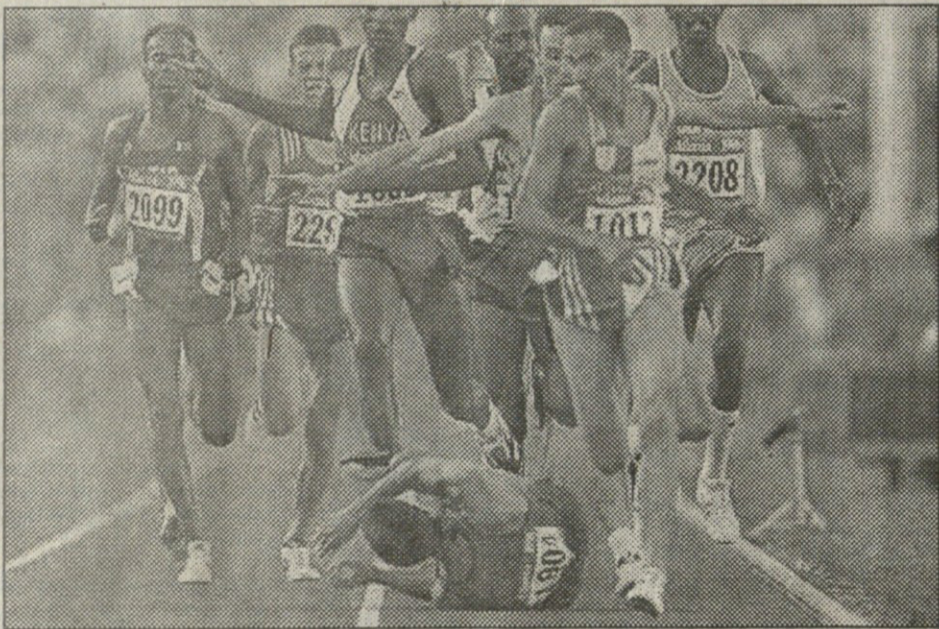
1500 მეტრზე სირბილის დროს მართკოვლი პიშამ ალ გერუვი დეცა, ილფირემა ნურადინ მორსელიმა და სხვებმა კი ბევრი იუქციეს