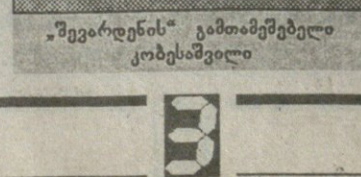
„შევიარდენის“ გამოუცნობელი კომენტარები

— თქვენ გამოუცნობებზე და ფსიქოლოგიურ მოუზიდებლობაზე ისაუბრეთ... შევიარდენის-ოსუ-მ ჩემპიონატი