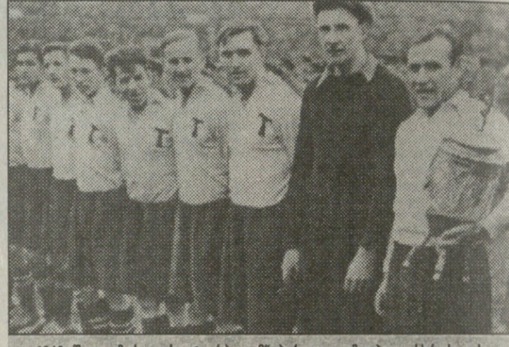
1949 წელი. მოსკოვის „ტორპედო“ პირველად მოიპოვა სსრკ-ს თასი