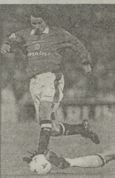
„დერბი ქაუნთი“ — „მანჩესტერ იუნაიტედი“ რაიან გიგზი მეტოქის მცველს გააშტო

არადა, პირველ ტამში „ვევირტონმა“ ორი დიდებული შესაძლებლობა გაუშვა ხელიდან: ჯერ იყო და ენდი პინკლიფმა კუთხური რომ ჩააწოდა, ხოლო გარი სიდიმა ძლიერი თავური დაარტყა, ალან რატიმა, რადგან ბურთის კარის ხაზდგან გამოტანა მოახერხა. ტამი რომ დასასრულს უახლოვებოდა, ტონი გრანტიმ ანდრიუ კანელსკის გაიყვანა ხელსაყრელ პოზიციაზე, დარტყმამაც არ დაყოვნა, თუმცა ოუქსმა ბურთის მოგერიება შეძლო. ბურთი შოტლანდიელ დანკან ფერჯიუსონს მოუგო.