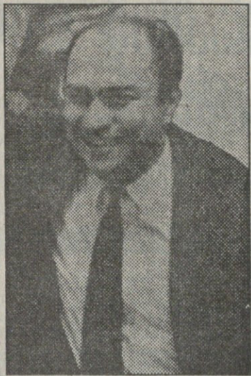
რომ დემოკრატია, რისთვისაც მან ვე...