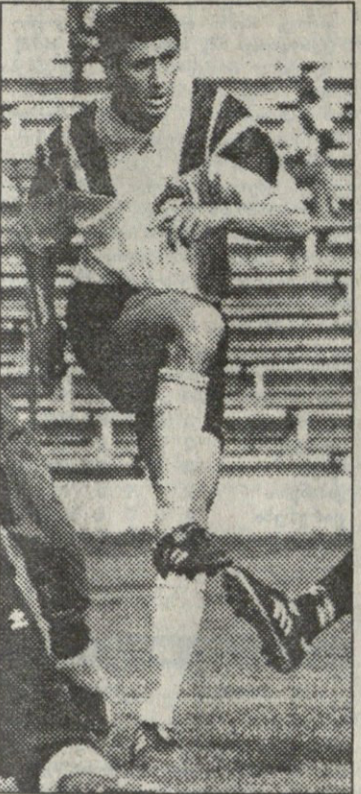
ბინა, პირველი ვინ გაიდავიყვანი მარცხენა ფლანგზე?

ახალი „დინამოს“ მიერ უეფას თასის სამი ეტაპის გაგლაში ვია ჩხაიკის