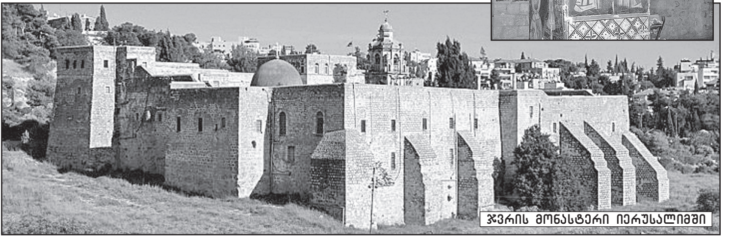
ჯვრის მონასტარი იერუსალიმში

ააივ „ქართული ფილმის განვითარების ფონ-დი“ ერთ-ერთი ტელეკომპანიის მიერ გავრცე-ლალ ცრუ ინფორმაციას ეხმიანება, თითქმის „თავა წულუკიანის შავ სიხს უსამსახუროდ ბი-ჩინილი კიდეც 50 ადამიანი დაემატა – კულტუ-რის მინისტრის ახალი სამიზნე აპპარატ თუშა-ნიშვილის თეატრის ეზოში არსებულ-ლი ააივის თანამშრომლები გახლან, რომლი-ბიც განმარტაბები გარეშე სახლში გაუშვას.“