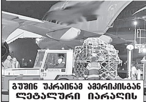
ბუშინ უკრაინაში აპირიისგან ლეზალური იარაღის დიდი პარტია მიიღო