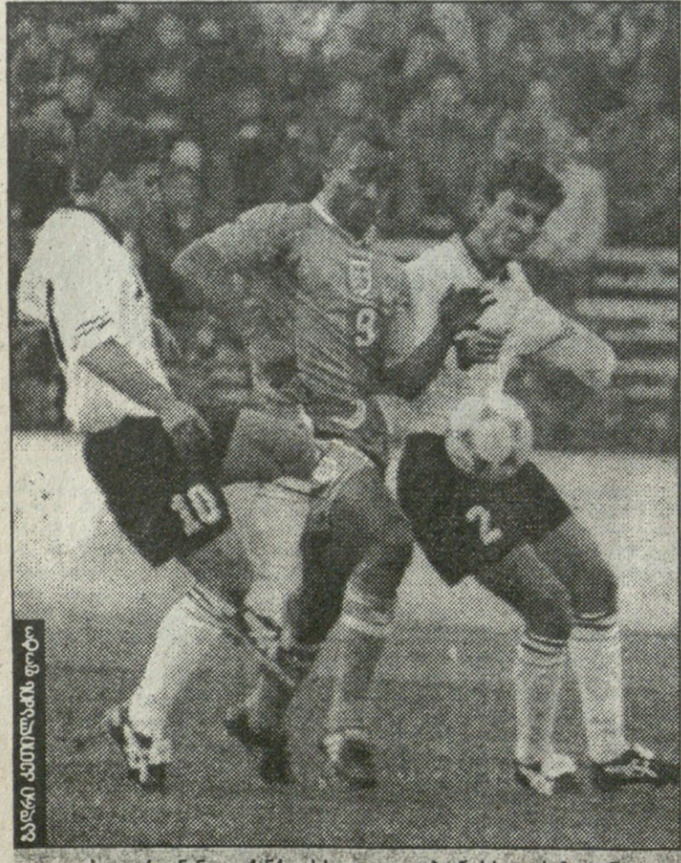
ლეს ფერდინანდი ქინკლაძისა და ლობჯინიძის გარეგონებაში