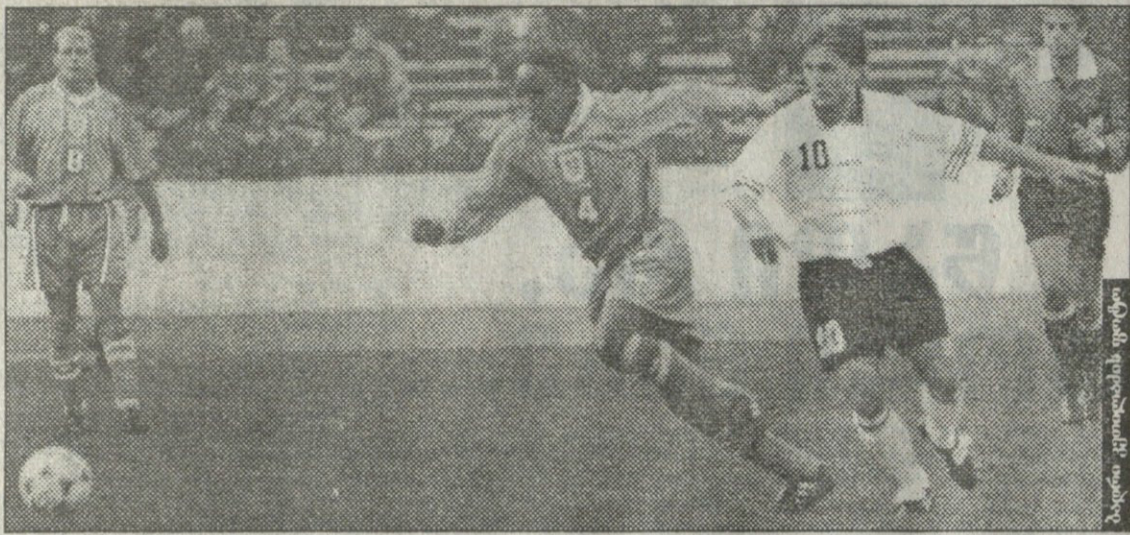
ბაგრაძე იმპროვიზაციის ფორმა