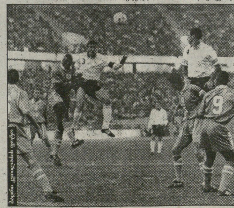
ბატონი კოლონელის ფოტო

დღესასწაული არ გამოვიდა. მთელი იყო გამოსულიყო. თუნდაც იმითომ, რომ შესვენებაზე სტადიონის სააირფარეგო ვაჭირებულნი ვერ დაიტბა და ნირწამხდარი მოქალაქენი იქვე გრძელ რიგად ჩაწვიბილნი ვეუფლებო ასეველებდნენ. ამინდი საღმრთისწაული იყო. მხოლოდ თამაშის შემდეგ წამოვიდა წვიმა, ოღონდ „იოკა-კოლას“ ცარიელი ბოლოებისა.