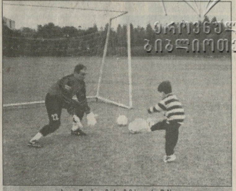
ხუთი წლის თემური მამის ივარჯიშებს

— „ილვასი“ ჩინეთში ამხანაგური თამაშები ჩატარა. თქვენს გუნდთანაც ხომ არ უთამაშობ? — დას. ეს შეხვედრა ავიტოვებ „შანხაიში ჩატარდა. მთელი მატჩი ვითამაშე, „ილვასი“ ძირითადი შემადგენლობით გამოვიდა, რობერტო ბაჯოც იყო. 0:1 წა-