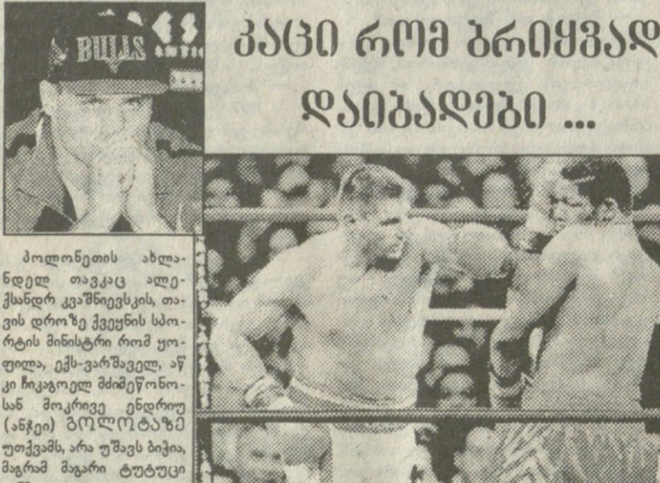
გოლოტამ ბოუს კი ურტყა, მაგრამ მერე რა?