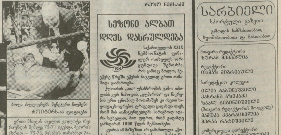
ბოუს ასულიერებს მენეჯერი ნოუმენი რიტიტანის-ის ფოტოები

პოლიტიკოსის ამ შეფასების სიმართლე ამ შაბათსაც დადასტურდა. 11 ივლისს, ნიუ-იორკის „მედიისონ სქუარ გარდენში“ გოლოტა არა-საჩემპიონოდ რომ შეერკინა ზანგ ექს-ჩემპიონ რადიკ ბოუს, ამკარად აჯობა, მაგრამ მე-7 რაუნდში სარტყელს ქვემოთ დარტყმებისათვის დისკვალიფიკაციით მასცეს, რასაც მერე რინგის გარშემო დიდი აურხაური და ჩხუბი მოყვა — 22 კაცი დაშავდა, 16 კი დააპატიმრეს.