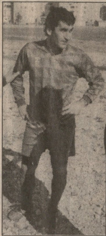
— თავდაპირველად ის გვითხარით, როგორ აღმოჩნდით ელისტაში...