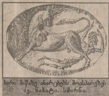
ხარი მიწაზე ანარცებს მოსპარებებს...