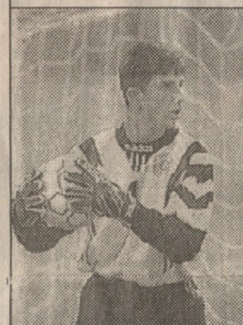
— თანამდებობა და ჩვენც ვისარგებლეთ ამ შემთხვევით.