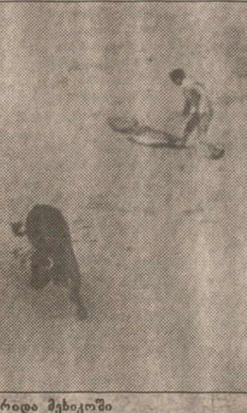
ოლიმპიური კორიდა მხეხილში