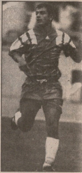
ლატვიელებს თამაშს ვერანთ, მაგრამ აღმოჩნდა, რომ „სკონტოს“ კაპიტანი ხალობოვი ჩარჩენილიყო.