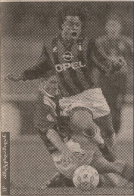
მილანელი დევიდის გლაზგოელ გაფთან ჭიდილში

თავიდან ყველა ყველას შეხვდა. „აიაქსმა“ „რეინჯერსს“ 6:2 მოუგო, „მილანმა“ „ლივერპულს“ — 5:0. მეორე შეხვედრაში ანგარიში ედგარ დევი-