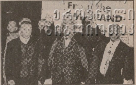
ლონ კინგი ტაინონისა და პოლიფილის სამოსო შერკინებას შექსირის „მაკეთის“ ყადაზე ნათლავს. ესო და წმინდა წულის „The Sound and the Fury“-ათ

დიდ პრომოუტერ (ქართულად „წარმოშინებელი“) ლონ კინზს რა შეეშლება — მბა-ის მიმეწონოს ჩემპიონი ევანდერ პოლიფილისა და ექს-ჩემპიონი მაიკ ტაინონის რე-მატჩამდე (ხელმეორედ შერკინებამდე) ზუსტად სამი თვე რომ დარჩა, პრეზენტაცია (წარდგენა) გამართა ნიუ-იორკის აეკვიტუბლ ბილდინგში“. თავად ჩნები 3 მაისს უნდა გაიმართოს პირველი შემსახვე ადგილას — აშშ-ის სამორინო (საყოფაზაზო) დედაქალაქ ლას-ვეგასის „ემ-ჯი-ემ გრენდ პარტლემი“.