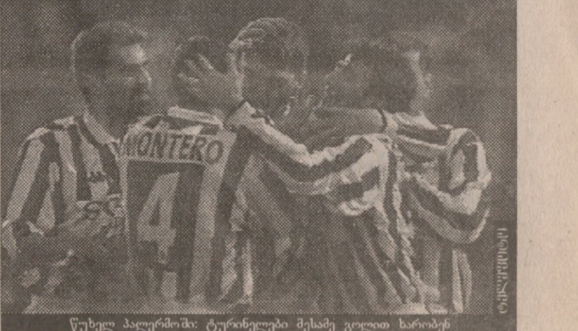
წახუშტი პალერმოში: ტურინელები მესამე გოლით ხარობენ

შთაბეჭდილება პირველი: ტურინელებმა ბრძოლი გადაწყვეტილება მიიღეს, შეხვედრა თავიანთი ქალაქიდან სიცილიაზე რომ გადაიტანეს. პალერმოს „ლა ფაორიტა“ გაივსო. შთაბეჭდილება მეორე: პარიზელთა პრესინგის და თავგამოდების მიუხედავად კლასმა თავისი გაიტანა. ფაქტი: „იუვენტუსმა“ ევროპის და მსოფლიოს ყველა მთავარი ჯილდო მოიპოვა!