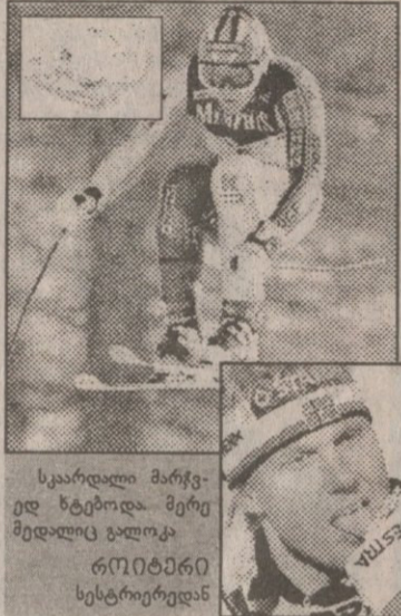
სკარდალი მარცხელ ხტობდა. მერე მდელიც ვალთა

წინა მდებარე ქალი სლოპსტოპები გაითამაშებდნენ. მერე ცდა შუა ვერტიკალი დროით 20 სათზე (ხეივანურად შუალაშით) დაიწყო და პარაპეტრონების შუქზე გაიმართებდა. ამას ამ სპორტის იმიჯის გასაუმჯობესებლად დიდი მნიშვნელობა ჰქონდა.