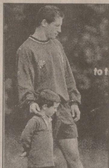
სმოლი ოჯახს უნდა მოეკიდოს, მაგრამ შინ არ უშვებენ

აფრიკელი რაგბის კანონებით ქვეითაუნის დასავლეთ კონცეს, შინაური მათ