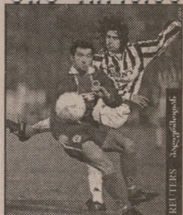
უპროვის სუპერკოპი პალერმოსთან