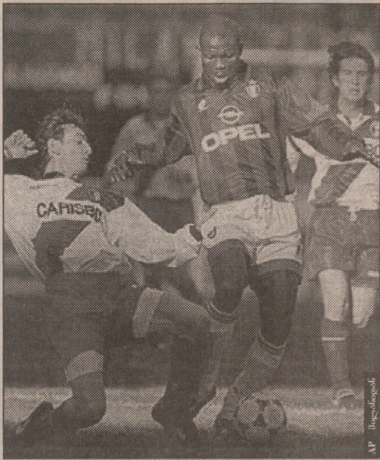
მილანი - ბოლონია. იმ დღეს ვიას შეჩერება შეუძლებელი იყო