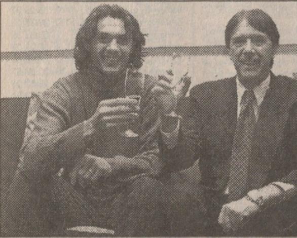
მაია-შვილი მალდინები წინებულ ხასიათზე არიან

იტალიელებთან „უმებლიე“ წაგება ინგლისელებთან პირველი სამხარო მარცხი გამოიწვია მსოფლიოს ჩემპიონატების შესარჩევ ტურნირებში.