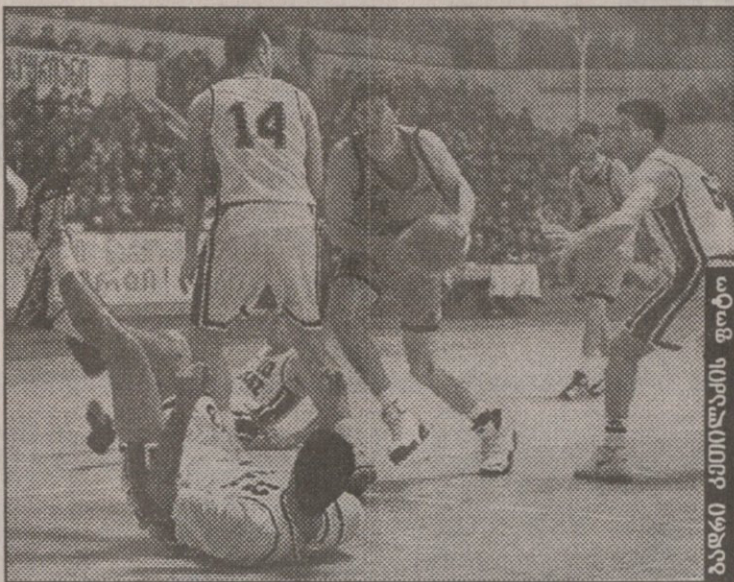
ბალსი კამილასის ფოტო

შემოთ ნახსენებ არეულ თამაშში უპირატესობა ჩვენი იყო, მაგრამ უფრო დანაწევრება ვერ მოვახერხეთ. ერთი რომ, ბერძენებმა მძლავრი ზონური დაცვა დააწყეს, სამქულიანებში კი არ ვაგვიძარბოდა ამის შედეგად ოთხი წუთი ბურთი ვერ ჩაგავდით, ბოლოს კი ჩხეიძემ ვაგეტანა ნახეი. ამასობაში სტუმრებმა აჯობეს რეოლებს შორის დარღვეული კაუბრი და მეორედ, მაგრამ მაინც წამოგვეწვივნენ. ტაიმის ცხრაქულიანი უპირატესობით გამთავრებით, მაგრამ ბურთის ფოლიდისთვის ვანკუთენილ ბოლო წამებზე ეკონომუს ვაუბრთობდნენ ჩაგვადებინეთ სამქულიანი.