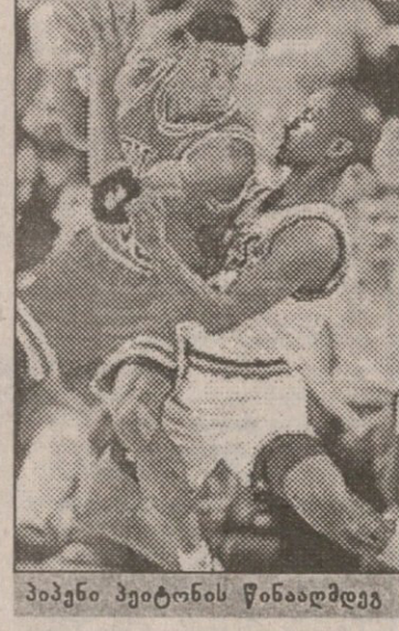
პიპენი პეიტონის წინააღმდეგ

„ჩიკაგო ბულზის“ ფორვარდმა სკოტ პიპენმა ცოტათი აჯობა შარლოტელ კოლეგას ენტონი მესონს და გახდა ნბა-ს მორიგი კვირის (17-23 თებერვალი) საუკეთესო მოთამაშე. ამ კვირაში „ჩიკაგომ“ სამიდან სამივე მატჩი მოიგო, ხოლო პიპენმა საშუალოდ მატჩში 32,3 ქულა, 6,6 მოხსნა და 5,5 პასი გააკეთა. პიპენმა ყველაზე კარგად იმ კვირაში „დენვერის“ წინააღმდეგ ითამაშა. მისმა გუნდმა 134:123 მოიგო, თავად სკოტმა კი 47 ქულა (პირადი რეკორდი), 5 მოხსნა, 4 პასი და 2 ჩაჭრა გააკეთა. წინა კვირაში პიპენმა 63-დან 37 ბურთი ჩააგდო (58,7 პროცენტი), 18 სამქულიანიდან — 7 (38,9 პროცენტი), ხოლო 17 საჯარიმოდან 16 ისროლა ზუსტად (94,1 პროცენტი).