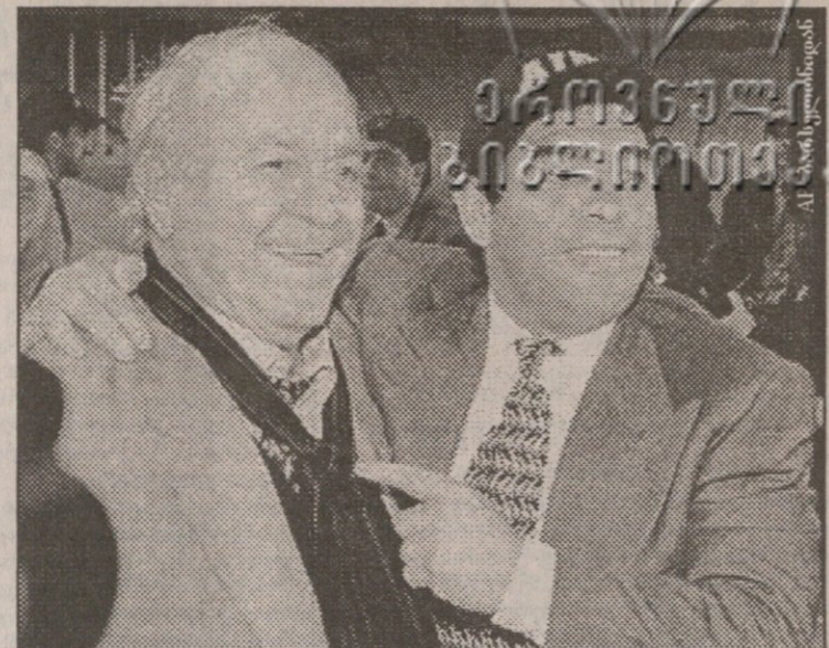
დიეგო მარადონის ლეგენდარული ალფრედო დი სტეფანო უკერს მხარს

ისრაელიის ქალაქ ერზიონში გაიმართა მასპინძელთა და გერმანიის ახალგაზრდული ნაკრებების თამაშური მატჩი. შეხვედრა 1:1 დასრულდა მატჩს.