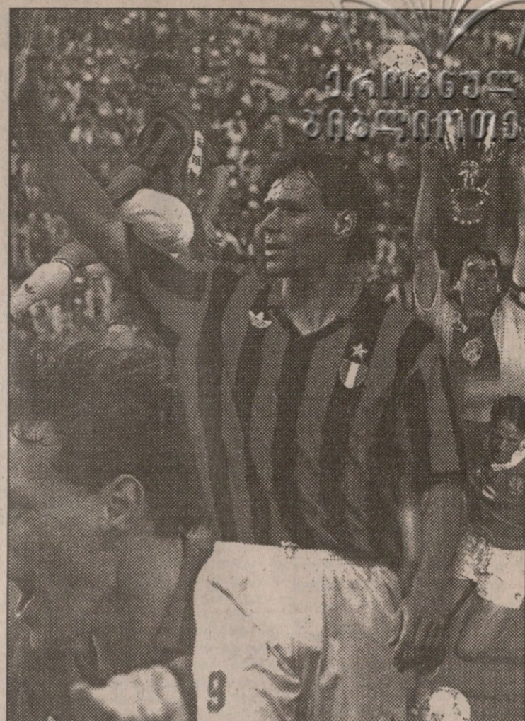
პოლანდიელი მარკო ვან ბასტენი, ვეროპის სამეზის საუკეთესო მოთამაშე, მისი ყოფილი ხელმძღვანელის არივო საკის აზრით, დიდი მწვრთნელი შეიძლება ვახდეს.

პოლანდიელი მარკო ვან ბასტენი, ვეროპის სამეზის საუკეთესო მოთამაშე, მისი ყოფილი ხელმძღვანელის არივო საკის აზრით, დიდი მწვრთნელი შეიძლება ვახდეს. ვან ბასტენი თანამემამულე რუდ გულიტთან და ფრანკ რაიკარდთან ერთად „მილანში“ ოთხმოციანი წლების მიწურულს ბრწყინავდა, ამ დღეებში კი გუნდს მილანელს საწვრთნელ ბაზაზე მიაკითხა. საუბრისა და ძველი მეგობრების მიკითხვა-მოკითხვის შემდეგ ვან ბასტენმა უკომენტაროდ დასტოვა ბაზა, ამიტომაც ჟურნალისტებმა საკის მიაკითხეს. „გულდი დამეწევა, როდესაც დაეინახე, როგორ თამაშობდა თავისთვის, როგორ ადგამდა დაშვებულ კოჭებს. ვან ბასტენი საგანგებო ვინიერების მქონე ფეხბურთელი იყო. საქმეს ხელი რომ მოჰკიდოს, ორ წელიწადში დიდი მწვრთნელი დადგება. იგი ვალდებულია ასე მოიქცეს. ყოველთვის ეწინასწარმეტყველებდი, რომ ჩემს ფეხბურთელთაგან ოთხი კარიერას სამწვრთნელი საშუალება გააგრძელებდა. გულისხმობდი ვან ბასტენს, გულიტს, კარლო ანჩელოტის და მარკო ტასოტის. დრო ამტკიცებს, რომ მართლაც ვამბობდი“ — თქვა საკიმ. მისი ოთხეულიდან ორი უკვე გუნდს ხელმძღვანელობს, გულიტი „ჩელსის“, ანჩელოტი კი „პარმას“. აწი ვერი ვან ბასტენსა და ტასოტიზეა.