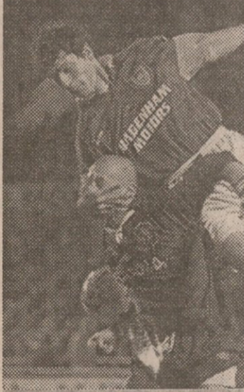
ვესტ ჰემი — ჩელსი. ასეც ცდილობდა ბილინი ვილის შეჩერებას