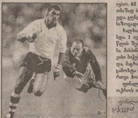
ინფორმაციები პირველი პარაკვი, 21 მარტი