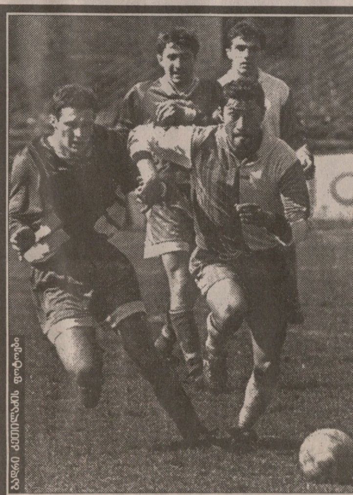
ბალნი კითხვების ფოტოები

ლიდერი შეიცვალა! მე-18 ტურის მატჩების რეპორტაჟები იხილეთ 2-3 გვერდზე