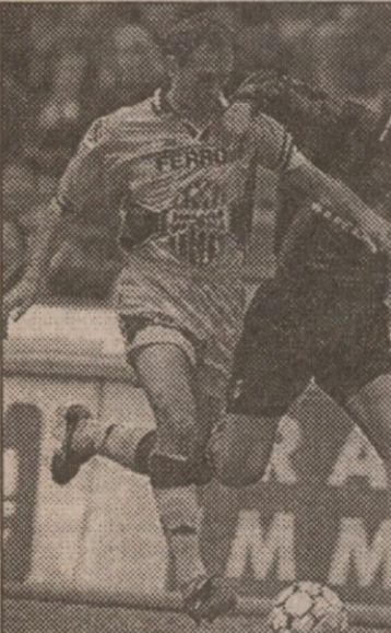
ბარცელონა — სევილია. სტუმრებმა ივანე დელა პენისა შეგერების ლაბოტნი...