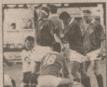
მერე კიდევ, შინური პირველობა ვერ გივარათო. ნაკრების თამაშებზეც ხალხი ცოტა მოვლდითო. არადა, გრენოლში სტადიონის ნახევარი საზღვრის იქედან გადმო-სულ ტალღეულ ქომაგებს შეეგვით.

„მისეთა მიზეზი მაინც სულ სხვაა. საერთაშორისო რაგბს დღეს იმეორა ფული შემოაქვს, რომ ევროპის დიდ ხუთეულს წილში სხვისი გაყვანა არა სურს. მეტიც, ინგლისი კარმან ისე გასწავლა, რომ ცალკე ტელეკონტრაქტი გააფორმა და ნაქები შეუიბრიდან კინაღამ გაირიცხა.