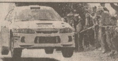
მაკინენის „მიტუბი“ ერთხანს მეორე მდილოდა

ორშაბათს მაკრეი ლიდერობდა, მაგრამ VI ეტაპზე ძრავა უმეტესად ბრიტმა მანქანა საკონტროლო პუნქტამდე კი მოაგორა, მაგრამ დაუფიქსირდა და გავარდა.