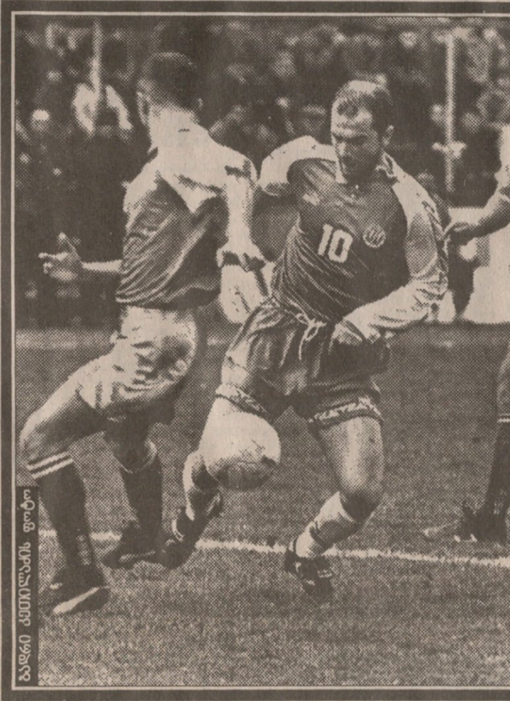
ბალნი კაითილაპის ფოტო

გუშინწინ თბილისის მუნიციპალიტეტის სხდომაზე ოფიციალურად დამტკიცდა საქცილი საზოგადოება „თბილისის ბორის პაიჭაძის სახელობის ეროვნული სტადიონის“ შექმნა. საკონტროლო პაკეტის მფლობელი ქალაქის მერია იქნება, ხოლო ყოფილი საკავშირო სპორტსაზოგადოება „დინამოს“ წილს ფიზკულტურულ-სპორტული კლუბი „დინამო“, საფეხბურთო კლუბი „დინამო“ და საქართველოს ფეხბურთის ფედერაცია დაესაკუთრებიან. ახლა ამ გადაწყვეტილებამ რეგისტრაცია დიდების რაიონის სასამართლოში უნდა გაიაროს, თუმცა ეს ფორმალური მხარე ალბათ ვეღარ დააბრკოლებს იტალიელებს, რომლებიც 2 აპრილს თბილისში საბოლოო მოლაპარაკების გასამართად ჩამოდიან.