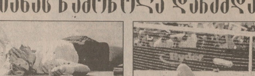
იანა ნავროლსა ამკვირსეული ჩვეული პოზა — წოდელდა: მაიოლისთან (ზევით) და ჰინგისთან მატრების შემდეგ