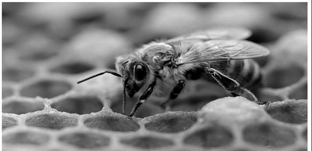
(დასასრული V გვერდზე)

ინფორმაციისათვის ჩემი საფუტკრეები განლაგებულია ზღვის დონიდან 800–დან