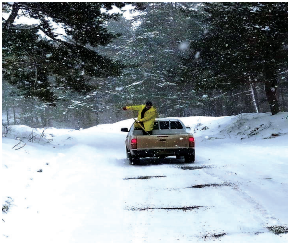
მაგრამ მზიანი ამინდები არ ჩანს და გამოდარებას უფრო თებერვლის პირველი დეკადის შემდეგ ვარაუდობენ.

რაც შეეხება, ამ კვირის ამინდს, სინოპტიკოსები, ჯერ-ჯერობით, საიმედო პროგნოზს ვერ გვპირდებიან. მართალია, ყინვა ოდნავ იკლებს,