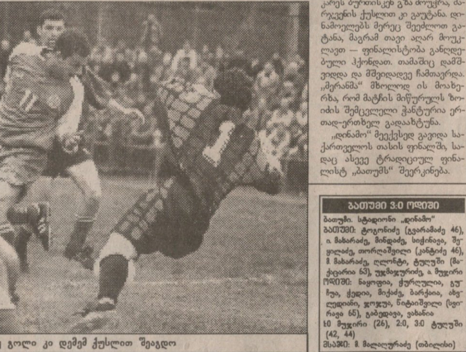
...მესამე გოლი კი დემეტრეს ქუსლით შეაგდო