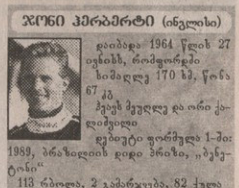
ჯიხი პირბილი (იტალია)