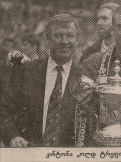
კანტინა ოლდ ტრეფორდს დაუბრუნდება