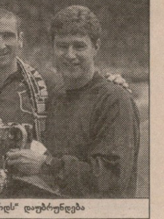
კანტინა ოლდ ტრეფორდს დაუბრუნდება