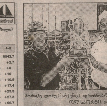
მორაგბე ლომუ (მარჯენივ) აფროსნობაშიც მგარია ოლ სკორტი თკლენდიან

მოლოდინი ვერ მართლდება, თუმცა ჯერაც ადრეა მთომაგი გრიგალები, ვეება ტალღები და მოხეტიალე აისბერგები. ქრის სუსტი პირქარი და ფლოტიც ნეტემის კუნძულებისკენ მიდრავს.