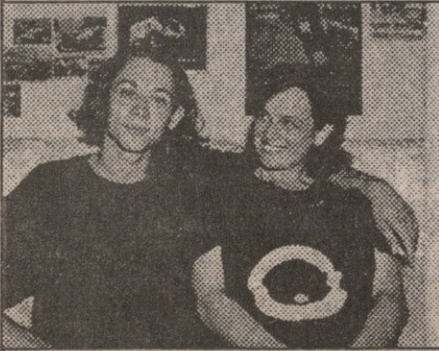
ჩემპიონი ვალენტინო მინც დედოცოს ბიჭა