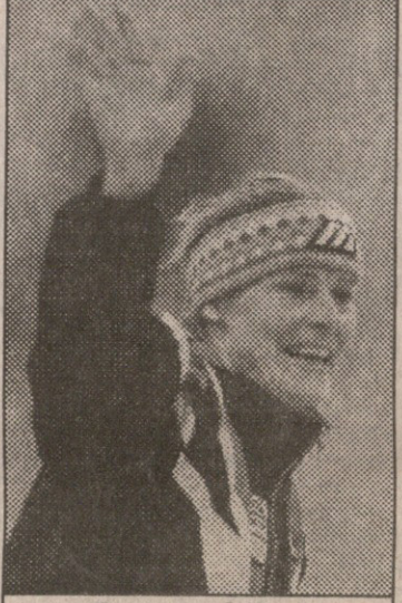
გუნდა კვლავ ჩემპიონია

კაუნჯაკის მთელი სამოსი კი არაა, არამედ მისი ორი ნაწილი. ორივე დაკბილულია, რათა მორბენლის სხეულის მეზობლად ვაკუუმს აღმოფხვრას. მოციგურავეს ერთი ამგვარი საღტე შუბლზე არტყია, კიდევ ორი კი — წვიპებზე.