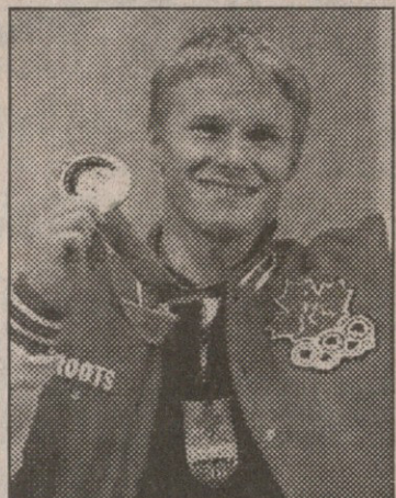
რებალიატი, მედალი ჩემპიონ

აქ კი ცოტა უნდა ითქვას სნოუბორდზე, როგორც არაოლიმპიურ სახეობაზე. როგორც სპორტი, სნოუბორდი მოავარაკეთა შორის იშვია და თავსებულადებული და გულმაგარი ბიჭების ვართობად იქცა. სნოუბორდის მოქრიალეთათვის წმინდა სპორტული იდეალები ხშირად უცხოა ხოლმე. ესენი, უბრალოდ