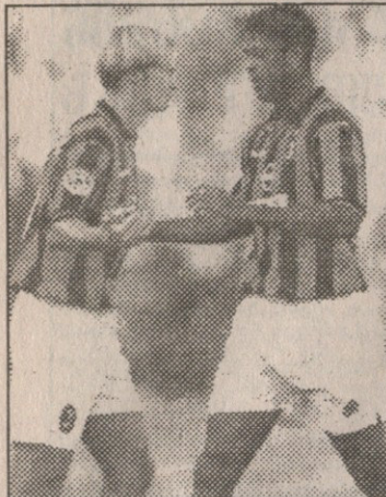
იყო დრო და მომენტი, ყველას ჯობდა კლუბიერტი

სად არის პატრიკ კლუბიერტი? ბოლო ცნობებით ის მილანში იყო, თუმცა, რას აკეთებდა იქ არავინ იცის.