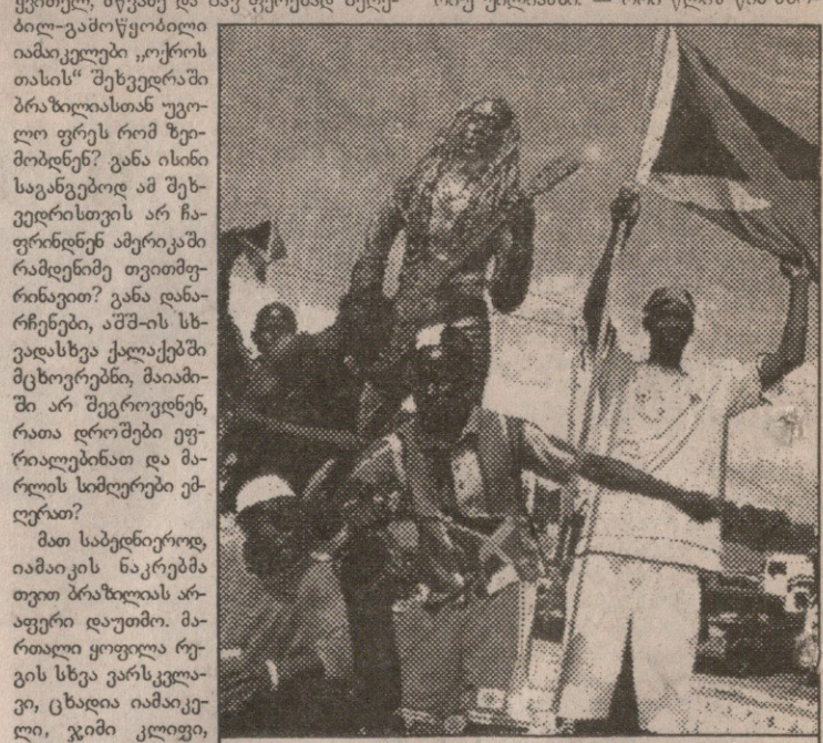
გულშემატკვრები ბობ მარლის ძეგლთან

რას ნიშნავს „რევი ბიზის“? „რევი ბიზის“ ნიშნავს რევის მოძღვრებას, მოცულობა და მოყვარულ ბიჭებს. ვინ არიან „რევი ბიზის“? „რევი ბიზის“ არიან იამაიკის ნაკრების ფეხბურთელები. ბობ მარლი რევის სამყაროს მბრძანებელი იყო. მისგან განსხვავებით, მისი თანამემამულე ფეხბურთელები პლანეტას აუტსაიდერებად მოველინებიან. თუ არ გვერათ, იფინის და ზეველი, საფრანგეთში მსოფლიოს ჩემპიონატი დაიწყება და ყველაფერი იქ გამოჩნდება. ისე კი აუტსაიდერები აუტსაიდერებად და გულშემატკვარებათა იხით არმიით, იამაიკას რომ ჰყავს, ბარე ური ვერ დაიკვებნის. ვინც საფრანგეთში ჩავა, ნახავს ფერად, ექსცენტრული ხალხს, რომელთათვისაც ფეხბურთი დროსტრატიაა. ახლა სამშაბათს არ იყო, მიაძის „ორანჯ ბოულზე“ ეროვნული დროშის ყვითელ, მწვანე და შავ ფერებად შეღებილ-გამოწვილი იამაიკელები „ოქროს თასის“ შეხვედრაში ბრაზილიასთან უოლო ფრეს რომ მოემობდნენ? განა ისინი საგანგებოდ ამ შეხვედრისთვის არ ჩაფრინდნენ ამერიკაში რამდენიმე თვითმფრინავით? განა დანარჩენები, აშშ-ის სხვადასხვა ქალაქებში მცხოვრებნი, მიაძიში არ შეგროვდნენ, რათა დროშები ფერიალებინათ და მარლის სიმღერები ემღერათ?