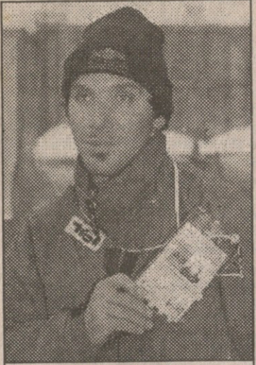
შეთის ბარათი რაში არგია?