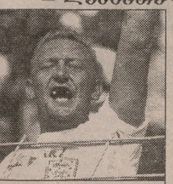
ფანი მე თქვენ ჯიგარს დაგვეც

ინტერნეტში ბოლიაისას კაცი რას არ აღმოაჩენს. გამორჩევი კი, ფეხბურთის მოყვარული. ერთმა ასეთმა კაცმა „სოკერნეტში“ განიარაღა და ამასწინა-თ საწუქარიც მომიძღვნა, ლონდონური კლუბის „ფულემის“ სონგბუქი, ანუ ფანური სიმღერების კრებული.