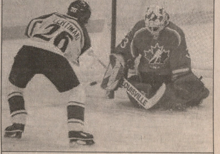
კანადელთა მეკარე მანონ რემს ვერც ახლა გაუტანეს

რას და ერთ-ერთი ბელარუსი ლამის გატყველია. ოლიმპიადის ყველაზე სახელოვანმა დებუტანტმა უეინ გრეცკიმ 1 პასი იკმადა.