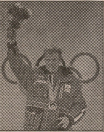
ლეგენდარული ბიორ დელი

ბიორ დელიმ ხუთშაბათს ზამთრის თამაშების ისტორიაში მამაკაცთაგან ყველაზე დიდ წარმატებას მიაღწია — 10 კილომეტრზე კლასიკური სტილით თხილაპურობაში თავისი მეექვსე ოლიმპიური ოქრო მოიპოვა. ერთპიროვნული რეკორდსმცემობისთვის ნორვეგიელს ერთი პირველი ადგილი ჭირდება, რათა ქალების ექვსჯინის ჩემპიონებს — საბჭოელ მოციგურავე ლიდა სკობლიკოვასა და მა-