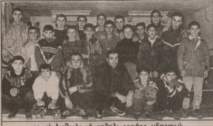
აი, ეს ბავშვები არ ეთმობა გიორგი კანდელაკს