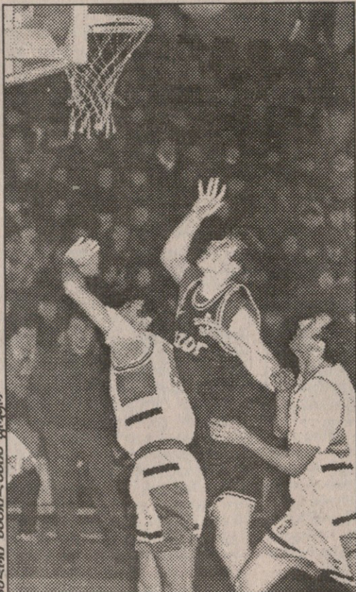
ვლადიმერ ბოისა ვითვლია გარემოცვაში

სდასუ 127:105 ბსკ სდასუ: ჩერქეზიშვილი (12), ჩხეიძე (11), სანაძე (21), ოთორიძე (34), დერიუჟინი (2); მგალობლიშვილი (15), მუშუგიაშვილი (21), აბულაძე (7), ახობაძე (2), ნაცვლიშვილი (12), ოქრუაშვილი ბსკ: დ. მოსინრაფიშვილი (15), ჭვონია (7), ჩხაიძე (1), თაბუაშვილი (9), მინაშვილი (8); ქართველიშვილი (18), შაპაშვილი (19), ნუცუბიძე (12) არმიელები ამ ჩემპიონატს კარგად ატარებენ, მაგრამ მათ პირველობის მეექვსე გუნდისთვის შეუფერლად სუსტი დაცვა