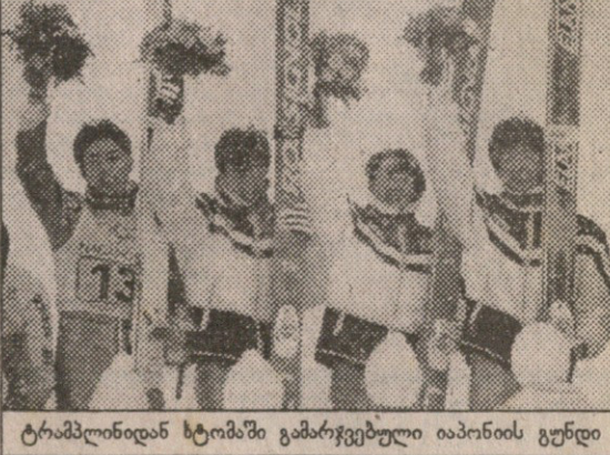
ტრამპლინიდან ტომაში გამარჯვებული იაბონის გუნდი