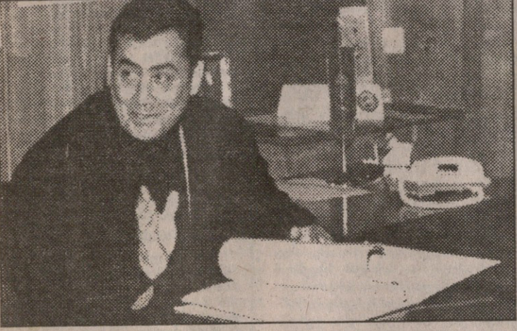
სამეგრეო გაზეთში, პირველი საბრძოლო

საბრძოლო გაზეთი გამოცემა 1990 წლის 28 დეკემბრიდან ხუთშაბათი, 19 თებერვალი 1998 №24 (559) ჯასი 40 თეთრი