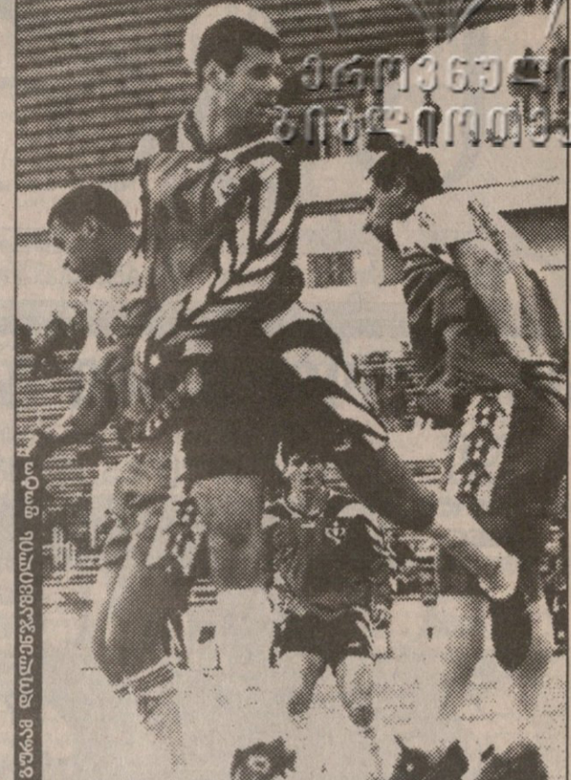
ხომერიკი ყავლაშვილზე და შაკიაშვილზე მალა

ნაინგლისემა ყიფიანმა ბექე- მისგან ვეშული მატკარაინა და ალბონელებთან ყბაგაბზარული კიქანძე მოისაკლისა. ნაკრების მწვრთნელს უმატკარაინობა ცი- ტიშვილმა არ აგრნობინა, რა- დგან ლიბეროობას უკვე მერამ- დენედ წარმატებით ვაართვა თა- ვი. აი, უკიქანძეობა კი „ლინა- შის“ მართლაც დაეტყო, რადგან კვარაცხელიამ მისი სრულფასო- ვანად შეცვლა ვერ შეძლო. ეს იქნებ იმის ბრალიც იყოს, გივი კვარაცხელიას, როგორც სა- ყრდენს, მძიმე სამუშაო რომ ევა- ლა. მას მინდორის ცენტრში მე- ტოქისთვის ბურთის ართმევა და პასუხით ანაბაძის მომარაგება ვესაძურდა. „სიონთან“ მატჩში ეს თითქოს არც უნდა ყოფილი- ყო ძნელი, მაგრამ ბოლო დროს მომლოდინებული და საკმაოდ ვარ- დამქონელი ანაბაძე ვისაც უნა- ხავს, დამეთანხმება, ძნელია, მას საქმეში დიდად შეეხილო, რადგან ანაბაძეს თითქმის არც საჭი- როებს. რაც უკონდა, იმას ვინ წაართმევდა და, ანაბაძემ თავის არსენალს წელს ესაც შემატა: გამაჯობებელი ფიზიკური გა- ძლიერება და თამაშისას გამოჩე- ნილი მეტი ყინი. ვერ დავიწყებ, „ლინაშის“ მატჩის ხმარად ვე- სწრები-მეოქი, მაგრამ იმისთვის კი საკმაოდ, რომ ვიქცა: დაკარ- გული ბურთისთვის მებრძოლად დაცვისკენ ჩაბრუნებულ ანაბაძე მელოდ ნათამაშე მატჩს ესაც ბუ- ნებრივად წააბა და თავის ფრთა- ზე ვავლახანდ არავინ ვააჭაჭანა. ინაშა და ლინაშო 2-ელივე მცვე-