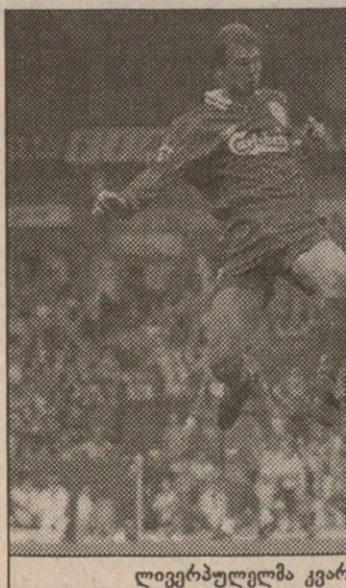
ლივერპულმა კვარამ გამორჩეულად ითამაშა

ლესტერი 2:2 მანჩესტერი ლესტერი: კლერი, გრეისონი, კამარკი, ველიოტი, უოლში, იხტი (კემპელი