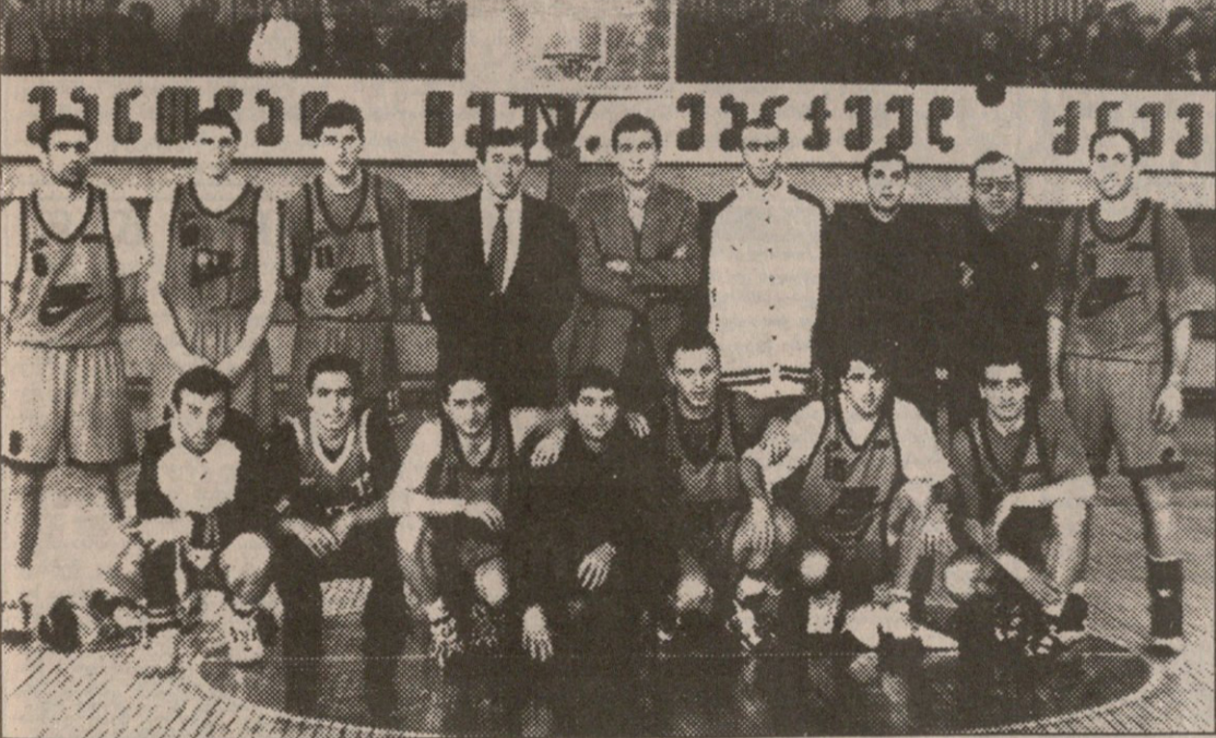
ვერის ბაღი. 5 მაისი. საქართველოს ჩემპიონატი. მატჩი შესაძებ ადგილისთვის. მეთორე შეხვედრა.

შაბათს თბილისის „ვითა“ მესუთედ გახდა საქართველოს ჩემპიონი