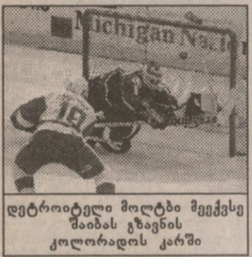
დეტროიტელი მოლტბი შეიქმნა შაიბას გზავნის კოლორადოს კარში

დეტროიტი — კოლორადო 6:1 მაიკლსონი (2:0), ლარიონოვი (2:0), კოზლოვი (3:0), ფორდოვი (4:0), მოლტბი (5:0), მოლტბი (6:0).