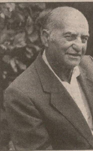
ცალქალამანიძეები წყვილად პაპა მირიანის შვილიშვილის იმედი აქვს

70 წელი შეუსრულდა მირიან ცალქალამანიძეს, ოლიმპიურ ჩემპიონობას თავი რომ დავანებოთ, მისებრ მრავალჯეროვანი და ლამაზად მოჭიდებულ ფალაჯანი ბევრი არ მოგვეგონება.