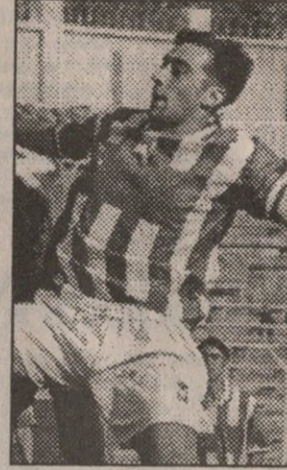
ლოპინგი ხომ არ ჰქონდა მიღებული... ლოპინგი ხომ არ ჰქონდა მიღებული...