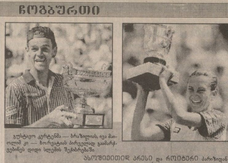
გუსტავო კერტენმა — ბრაზილიელი, ივა მაილიმ კი — ხორვატიას პირველად გაიმარჯვინეს დიდი სლენის შეჯიბრებაში