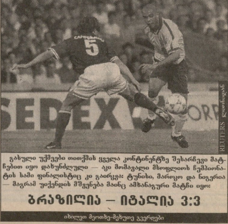
გასული უქმეები თითქმის ყველა კონტინენტზე შეხარჩევი მატჩებით იყო დახუნძლული — აუი მომავალი მსოფლიოს ჩემპიონატის სამი ფინალისტიც კი გაიარკვა: ტუნისი, მაროკო და ნიგერია — მაგრამ უქმედის მშვენიერება მინც ამხანაგური მატჩი იყო:

დღეს, 17 საათზე, საქართველოს სპორტის დეპარტამენტში გაიმართება სამხრეთაფრიკელი ჩემპიონატის მსოფლიო ჩემპიონატის მსოფლიო პრესკონფერენცია სამხრეთაფრიკელი ფედერაციის წარმომადგენელთა მონაწილეობით.