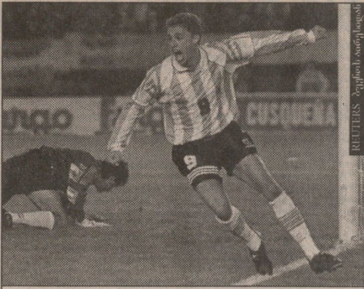
არგენტინა — პერუ. ერნან კრესპო პირველ გოლს ხაზობს

საქართველოში ფეხბურთის განვითარების შესახებ. ავტორი: ვახტანგ კვიციანი. ტექსტი შეეხება სპორტის განვითარებას და ახსენებს სხვადასხვა საკითხს.