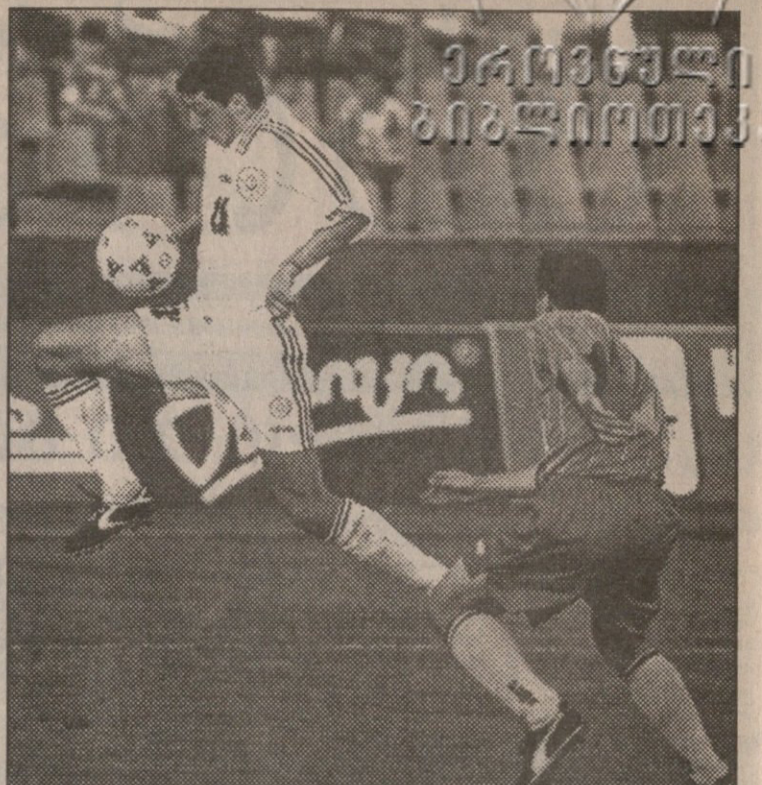
შოთამ მსოფლიო ჩემპიონატზე ქართველთა პირველი გოლი გაიტანა

ახლა ეს შენიშვნა ვიკმართ და კარგზე ვთქვით. ყველა ფეხბურთელი თამაში უკეთესის სურვილს ვერ აქრობდა, მაგრამ ესაც, ცუდად არავის უთამაშა, რამდენიმე კი გამორჩეულად კარგად ითამაშა. ზოიმით დავიწყეთ. მართალია, იგი ორიოდეჯერ შეაწყუნეს, მაგრამ მეტოქის ორჯერად ადვილზე დახედა, მაშინ კი, როგაიოვის წინ რომ გამოუსტა, დარტყმის კუთხე შეუმცირა და აცილებდა ხელი შეუწყვი, კახი ცხადამე რამდენჯერმე კი შეცდა, მაგრამ ბე-