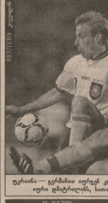
ურუგუა — ფინეთი: იურგენ კლინსმანი მასპინძლებს, კერძოდ კი იური დიბტირიტის, სათანადოდ ჰყავდათ ამოკეტა.

გოლი: 1:0 ვანბალა (59), 2:0 ლიტმანნი (63), 3:0 სუმილა (81) ნორვეგია 5 3 2 0 11:2 11 ფინეთი 5 2 1 2 8:6 7 უნგრეთი 5 2 1 2 5:5 7 შვეიცარია 4 2 0 2 4:4 6 ანტიგუა 5 1 0 4 2:13 3