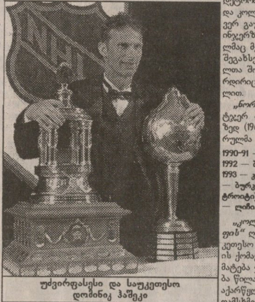
უძვირფასესი და საუკეთესო დომინიკ ჰაშეკი

„პარტ მემორიალ ტროფი“ 1924 წლიდან თამაშდება. მისი პირველი მფლობელი ოტაველი ნაიბორი იყო, რეკორდსმენი კი უეინ გრეცკი გახლავთ, რომელსაც 9-ჯერ (1980-87, 89 წლებში) მოუგია ეს პრიზი. ლეგენდარულმა გორდი ჰოუმ 6-ჯერ (1952, 53, 57, 58, 60, 63) ირგუნა.