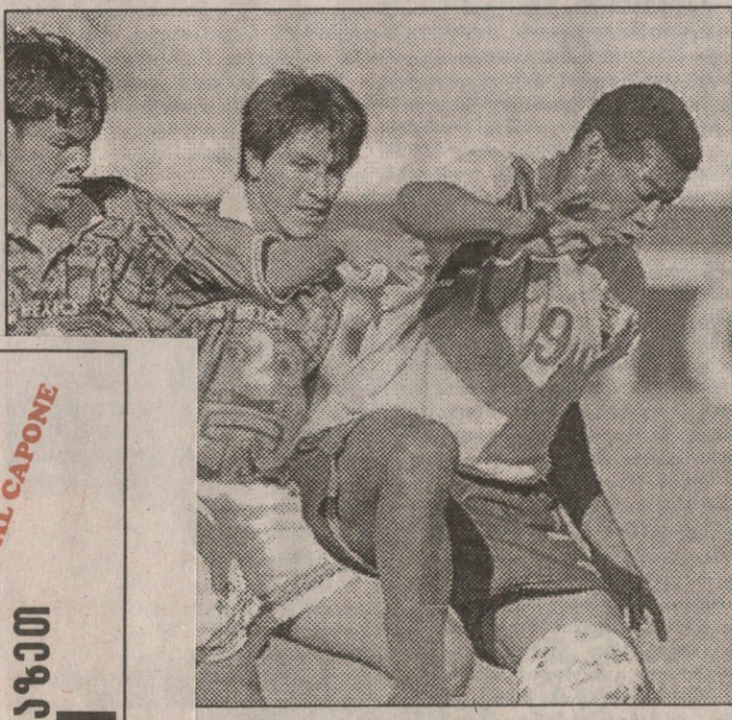
ბეგრი იჭიდავებს, მოგებულნი კი პენალტებმა გაარკვია

მესამეა XI კაპალორი (პენალტები 4:3) მესამეა: როსი, პარდო (როსი 55), სუარესი, ფაინო, ვილა, ლარა, სანჩესი, რომერო, რამირესი (ჩავერი 62), ბლანკო, ერნანდესი მესამეა: იბარა, კონსტანტი, ფელა გრუზი, მენდესი, ტენორი (მონტანო 46), კაპურო, კარაბალი, სანჩესი (როსი 82), გაგია (ფერნანდესი 75), გრაციანი, ურტადო მოქმედი: XI კაპურო (5 მ), XI ბლანკო (17)