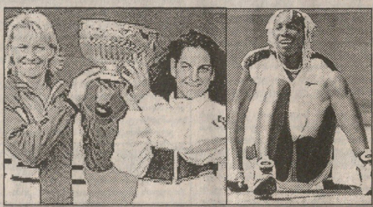
ისტორიული ამბები: ფინალი ორ დღეშიც რომ ვერ ჩამთავრდა, თასი საზიაროდ ასწვიენს ნოვოტანსა და სანესს, მომავლის ვარსკვლავი ვილიამსი კი მისსვე დაბადების დღეს გააგლო ბებერმა და უპერსპექტივო ტოზიამ

სრუტის გაღმომპა რომალები (პოლანდია) ბანინეპანის ტანსი. ბალანი ქალები (სამრიზო ფონდი 164 250 US$). მეოთხედინალი: ანკე პუბერი (გერმანია-1), 1) — სამინე აკლამინი (ბელგია, 5) 6:2, 4:6, 7:6 (7-4); მირიამ ორემანსი (პოლანდია) — კარინა პაპსდოვა (სლოვაკეთი, 4) 6:2, 7:5; რუქსანდრა დრაგომირი (რუმინეთი, 3) — დომინიკ ფანრუსტი (ბელგია, 6) 6:1, 2:6, 6:4; ასა კარლოსი (შვედეთი, 8) — მარი პირსი (საფრანგეთი, 2) უარი. ნახევარფინალი: ორემანსი — პუბერი 4:6, 6:4, უარი; დრაგომირი — კარლოსი 6:4, 6:2; ფინალი: დრაგომირი — ორემანსი 5:7, 6:2, 6:4