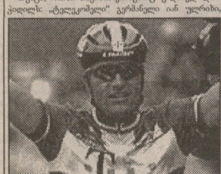
შარშანდღელი „ტურის“ ჩემპიონი ბიარნი რიისი

აი, ესენი შეეტოქებინა მელოტ დანიელს. თუმცა, რიისი თავისიანებისგანაც უნდა ვივლიდოს კვილი: „ტელეკომელი“ გერმანელი იან ულრიხი,