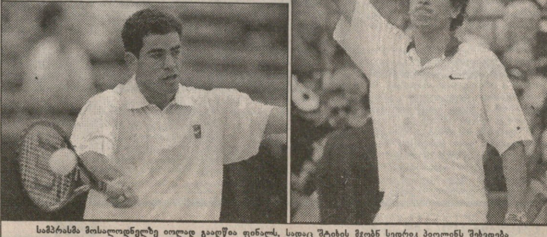
სამპრასმა მოსალოდნელზე იოლად გააღწია ფინალს, სადაც შტიხის მჭობ სედრიკ პილინს შეხვედა

(ხელგია), მირიამ ორემანსი (პოლანდია) — ლინდსი დავენორტი (აშშ), იანა ნოვოტან (ჩეხეთი) — (უარის) ლარისა ნიელანდი (ლატვია), პედერს სუკოვა (ჩეხეთი) — ელიზ გალენსი (ბელგია), ჯინჯერ მელგესონ-ნილსენი (დანია) 6:4, 6:4; ნიკოლ არენტი (აშშ), მანონ ბოლდერაფი (პოლანდია) — მარტინა შინგისი (შვეიცარია), არანსა სანმესი (ესპანეთი) 6:4, 5:7, 6:2 ვაჭა წყვილები (ნახევარფინალი): იაკო ელტინგი, პოლ პაარპუსი (პოლანდია) — მარტინ დამი, პაველ ვიზნერი (ჩეხეთი) 6:2, 6:2, 6:4 შპრეპული წყვილები (მეოთხედფინალი): სუკი, სუკოვა (ჩეხეთი) — კინერი (აშშ), მიაგი (იაპონია) 6:2, 7:5; ოლზო-გსკი (რუსეთი), ნეილანდი (ლატვია) — პავსი (ინდოეთი), დრაგომირი (რუმინეთი) 6:3, 7:6.