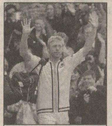
ბეკერის უიმბლდონი: 1984-1997

უიმბლდონის ტურნირის მეორე კვირას მხოლოდ ისეთი ჩოგბურთელები შემორჩნენ, რომლებმაც ცეცხლითა და მახვილით გაიკაფეს ვაზა სანუკარი მიზნისკენ — ცენტრალურ კორტზე ფინალის შემდეგ დიდი ვერცხლის თასის აღმართვაზე ხომ უკლებლივ ყველა ამბიციური ჩოგბურთელი ოცნებობს. მაგრამ თუ კაცთა ტურნირზე ამინდს ვეტრანები ქმნიან, ქალებში ჰემპარიტად ემსწილთა ექსპანსიაა.