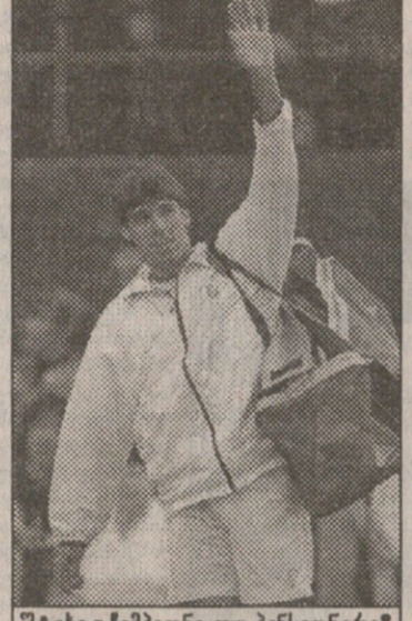
შტიხი - ჩემპიონი თუ პენსიონერი?

იმასაც რომ წავევო, რაიხის ქვეყანაში ნამდვილად საყოველთაო გლოვას გამოაცხადებდნენ. შტიხი მასპინძელთა იმედს, ჰენმანს ერკინებოდა. ინგლისელი ფავორიტად ითვლებოდა ამ შეხვედრაში, მაგრამ სასტიკი დამარცხება კი იგემა — 3:6, 2:6, 4:6. მატჩის შემდეგ შტიხმა განაცხადა, თამაშს თავს კი ვანე