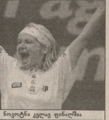
იანა ნოვოტნა კვლავ ფინალშია

მეორე ნახევარფინალში ძველი თაობის ორი გააფთრებული ბუ მგელი ეკეთა ერთმანეთს. ჩეხი იანა ნოვოტნა, მატჩის შედეგის მიუხედავად, კლასიფიკაციაში პირველად აღზედა მე-2 ნომრამდე, არანა სანჩეს-ვიკარიოს კი წაგების შემთხვევაში კიდევ უფრო დაქვეითება ელოდა. მეტოქეებმა, რომლებიც ადრე ერთ წვეთში თამაშობდნენ, მატჩის დაწყებამდე საკმაოდ უდვილად მოიხსენიეს ერთმანეთი, რამაც თამაშისადმი ინტერესი კიდევ უფრო გააცხო-