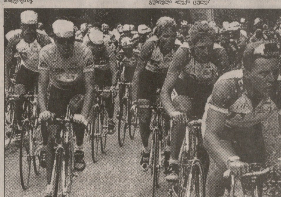
აი, ეს არის „ტურ დე ფრანსი“. საფრანგეთის ველოსაიდი — შუა ზაფხულის გიჟური რბოლა დიდებისათვის.

დას, ველოსაიდი მითუმეტეს, რომ დღეს, 5 ივლისს სამეაროს ერთ-ერთი ვეელაზე საოცარი, ვეელაზე დიდებული და საინტერესო შეჯიბრება იწყება: ველოსაიდებით საფრანგეთის გარშემო — მთები, ველები და სამხრეთის გახურებული გზები, დამსკდარი ტურები, მოდელი ველები და მტკიცეანი წელი — დაუთვლებელი ლტოლვა წინ — ეტაპის ფინიშისაკენ. სიკვდილი გაზე და ლიდერის მთლად სველი მისური. არაქათამომცემელი 25 დღე და მშვენიერი, ლამაზი, ნაღდად სპორტული და ვაქაცურული დასასრული პარიზში, ელისეს მინდერბეზე.