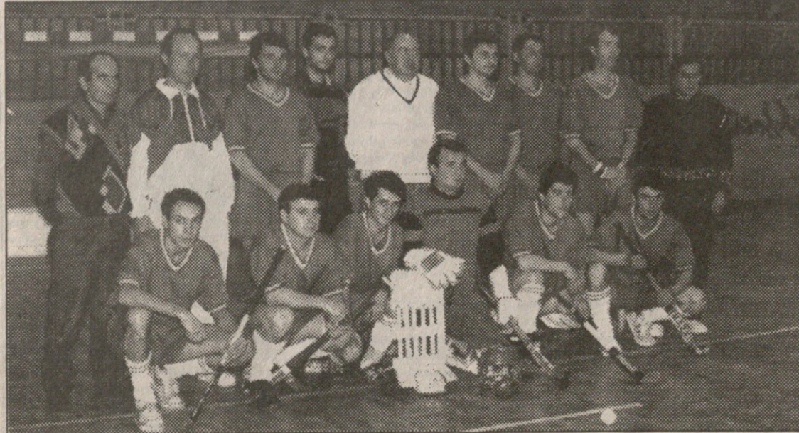
საქართველოს პოეტისთა ნაკრები