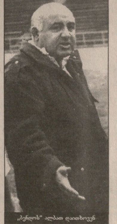
„ბენდოს“ ალბათ დაითხოვენ

იყო მოსალოდნელი, მაგრამ რაკი ყველა წვერის შეკრება ვერ მოხერხდა, გუმინდელი სხდომა გადაიდო. ინციდენტის მონაწილეები რაგბის კავშირის ოფისში აღარ გამოჩენილან. რაკი ჭაბუკობიდან მეგობრები არიან და ბარემ ათი წელი ერთად უთამაშიათ „ლოკომოტივიში“, ალბათ საერთო ენას თავად გამოიხახვენ. ერთი კი ამთავითვეა სათქმელი, რომ ის, რაც 25