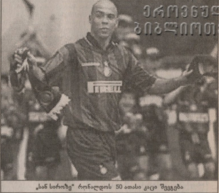
„სან სიროზე“ რინალდოს 50 ათასი კაცი შეეგება

ამრიგად გაისად 7-28 თებერვალს აფრიკის ჩემპიონობისთვის იბრძოლებენ მასპინძელი ბურკინა ფასო, სამხრეთ აფრიკა (თაისის მფლობელი), განა, ანგოლა, კოტ დიუვარი, ალჟირი, მაროკო, ეგვიპტე ტუნისი, გინეა, კამერუნი, ნამიბია, ტოგო, კონგოს დემოკრატიული რესპუბლიკა, ზამბია და მოზამბიკი.