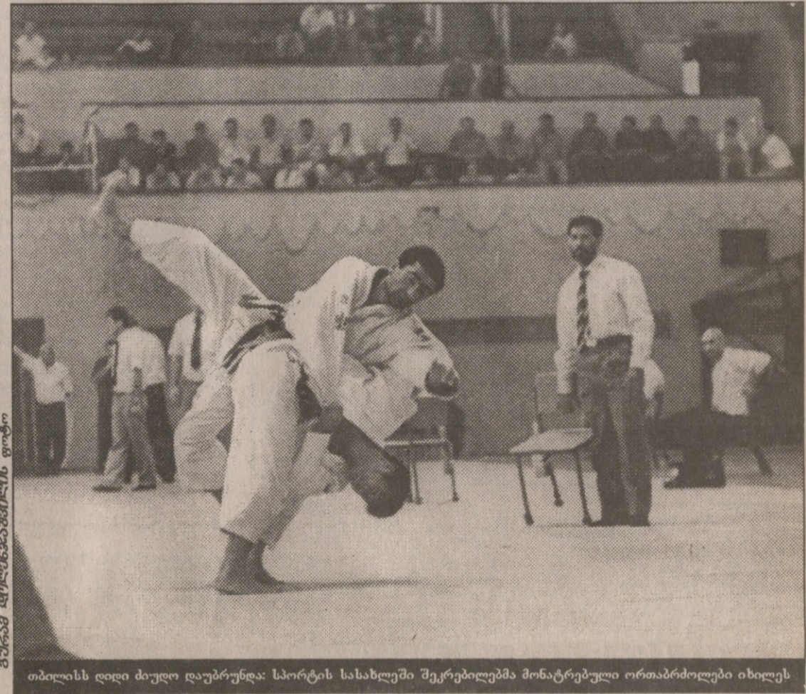
თბილისის დიდი ძიუდო დაუბრუნდა: სპორტის სასახლეში შეკრებილებმა მონატრებული ორთაბრძოლები იხილეს