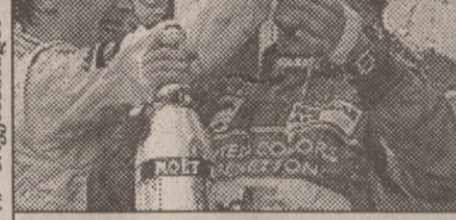
გამარჯვებულია ჩვეული ანცობა: ჰაინენი, ბერგერი და მისაელ შემასერი შამპანურით წუწაობენ

შემდეგ ფორმულა 1-ის 37 წლის ვეტერანს ოპერაციის გაკეთება მოუხდა ავიაკატასტროფაში მამაც დაეღუპა და თითქმის ორი თვე არ გააკარებდა საჭეს „პოპენაიმიში“ რბოლას მონაწირებული ავსტრიელი ჩემპიონატს დაუბრუნდა: თავიანთსმცემელთა გასახარად პოლუცი მოიპოვა, წრის რეკორდს დააყარა და გა-