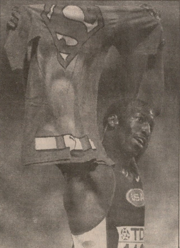
400 მეტრზე რბენაში ამერიკელმა მაიკლ ჯონსონმა იოლად, მას რომ ეკადრება, ისე გაიმარჯვა

სამსტრამოლო საუბარს გერმანიის მაყურებლის ქებით დავამთავრებ. მიუხედავად იმისა, რომ ამ სახეობაში საკუთარი სპორტსმენი ჰყავდათ, რომელსაც, როგორც მოგახსენებთ, დიდი თავგამოდებით ქომაგობდნენ, ისინი სხვებსაც უჭერდნენ მხარს. ასეთი ალალა, სპორტული სულისკეთება აუ რამდენი ხანია აღარ მინახავს. სთხოვდა კეანი მსტრამოლო, ტაშით გამამხნევებო, და გულითადად ათენური პუბლიკაც დიდი მონდობით აქეზებდა მთხონელს. აქეზებდნენ ყველას, მათ შორის სარკა კასპარკოვასაც და უნდა გენახათ, რა აღფრთოვანება გამოხატეს კასპარკოვა კარგად რომ გადახტა. შეჯიბრების დამთავრების შემდეგ გახარებულმა კასპარკოვამ ჩეხეთის დროშასთან ერთად გერმანულიც ააფრიალა. ეს, ცხადია, მაღლობა გახლდათ. ეკუთვნოდათ კიდევ.