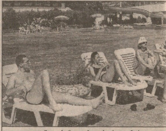
„ლაგუნა-ვერეს“ — თბილისური ოაზისი

— წყალბურთის გარდა ძლიერი ეროვნული ნაკრები სხვა სახეობებში არც გვყავს, მხოლოდ ერთი სპორტსმენი ბრწყინავდნენ. საწყალბურთო ტრადიცია კი უნდა აღდგეს, მაგრამ, მოდი, ნუ ვიჭქარებთ ეროვნული გუნდის შექმნას —