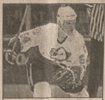
შონ პრონგერმა პიტსბურგი უნდა გააძლიეროს

ლიან პერსპექტიული პოკეისტია, მაგრამ ჩემი კონფერენციის გრანდებთან საბაეტიოდ მაღალი და ათლეტიკური მცველები გეჭირდება“ — განაცხადა გუნდის გენერალურმა მენეჯერმა ბობი კლარკმა, რომელმაც ნინიმა და მათი გამოცდილება, შესაძლოა, გამოადგეს კიდევ დალასს. რაც შეეხება ჩემპიონობის კიდევ ერთ კანდიდატს, ნიუჯერსის, მას ზემოაღნიშნული პრობლემები ნაკლებად აწუხებს, ამიტომაც გასაკვირი არ არის, რომ „ექვსამეზბა“, ისევე როგორც ბოსტონმა, ლოს ანჯელესმა და ოსტონმა, „დედლიანი“ ყურადღების მიღმა დატოვეს. თუმცა ერთი გამოკვეთილი გოლეადრი, თუნდაც იგივე ალექსანდრ მოვილი, რომლითაც კლუბი დაინტერესებული იყო, ნიუჯერსელებს ნამდვილად არ აწყენდათ. შემთხვევითი არ არის, რომ „ექვსამეზბის“ ყველაზე შედეგიანი სნაიპერი ყოფილი „პერსონი“ რენდი მაკეი გახლდათ. აღსანიშნავია რეინჯერსის აქტიურობა, რომელმაც ერთმანედ თიხი მოთამაშე გამოიყვანა. ზემოხსენებული კინისა და სკრუდლანდის მაგივრად ნიუორკელებმა პერსპექტიული ტოდ ჰარე მიიღეს (მასთან ერთად იმეათად მოთამაშე ვეტრანი ბობ ერეკ მივიდა კლუბში), რაც სერიოზული საფრთხე განაცხადია. მეკარე მუცატე სანხოსელ ახალგაზრდა მცველ რიჩ ბრენ-