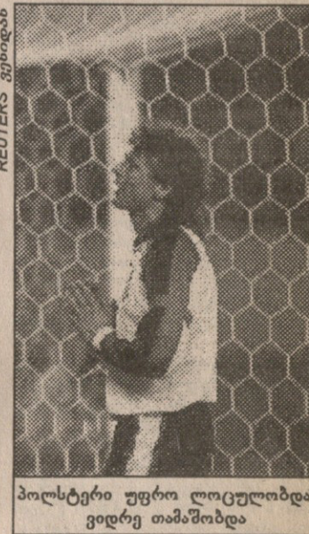
პოლსტერი უფრო ლოცულობდა, ვიდრე თამაშობდა

ავსტრია: კონსელი, შობი, შოტელი (პეფერი 46), ბიდენი, ფაინზინგერი, მაელოხი, ვასტერი, კუნსთაერი (რანმაიერი 46), პოლსტერი, პერევი (შტოიგერი 46), ამერპაუზერი უნდრეთი: კრალი, პრუტკა, სეპოვი, მატეუსი, ფეგერი, პალმაი, ვრმევი (კოვანი 70), ლიშტენი, ხორვატი (ტოტი 31), ოლეში, კორსოში (პამანი 46) 0:1 ხორვატი (4), 1:1 ვასტერი (10), 2:1 ამერპაუზერი (21), 2:2 2:3 ოლეში (32, 54) აქამდე ავსტრიას ზღვიზედ ხუთი მატჩი მიეგო. ბრყინავილ შედეგის ექვ-