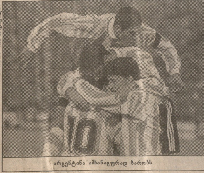
არგენტინა ამხანაგურად ხარბის