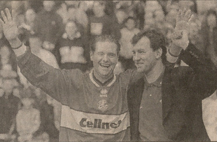
გლანგიდან გაპარული გაზა (მარცხნივ) ბრაიან რობსონთან ერთად „რივერსაიდის“ პუბლიკას ესალმება

მცველი გრემ ლე სო და „მანჩესტერ იუნაიტედის“ ყოფილი ფორვარდი მარკ პოუზი პრემიერლიგის ტიტულის სითბო რომ შეუგრძნიან... არც „მიდლსბროს“ გაზლავან ნაკლები ბიჭები იტალიურად მის გასახდელშიც ლაპარაკობენ და ფეხბურთელებს იქაურ სამსახურში დალოდე სხეულზე წყალში რომ ივლებენ, მთელს მსოფლიოში სახეზე ცნობენ. მილანის „ინტერსი“ ყოფილი თავდასხმელი მარკო ბრანკა და ნახევარმცველი ვანალუკა ვიალიც სხვაზე არანაკლები კერეტი კაკლები არიან. ახლა მწვრთნელი? ბრაიან რობსონის ვინმეზე ნაკლები სახელი აქვს დაეფალო? ფესტა ძოლაში არ იყოს, სარდინიელია, ბრანკას კი ვილისთან ერთად „სამპდორიაში“ აქვს ნარბენი. იგი ერთხანს, სანამ დი მატეო „ლაჯიოში“ გადავიდა, „რომაში“ მისი თანაგუნდელიც იყო. ინგლისელებზეც ვთქვათ. ნაკრების მოთამაშე ბოლ მერსონი 13 წლის მანძილზე „არსენალში“ იყო და ჩემპიონობაც უგემია და თასიც. ამ დღეებში მას „გლასგო რივერსი“ და „ბოლს“ მთელი შემჯობვა ღლით მძაკეცი, 1991 წელს „ტოტენჰემში“ ფეხბურთის ასოციაციის თასი რომ მოიგო. გექსონი დი მატეოსთან ერთად „ლაჯიოში“ იყო. მან მაშინ, 91-ის ფინალში მუხლი იტყინა და მას მერე „უემბლიზე“ გადაწყვეტ სათასო შეხვედრაში აღარ გაუნარედა. ხვალ იზამს. ისტორიას სარ დავაგა? და მინც, რა ვინდ ბევრი ვილაპარაკით „მიდლსბრო“ „ჩილსის“ არაფრით ჩამოუვარდება, გადაფურცლავ ისტორიის წიგნს და მიხვდები, რა საჭირო საგანია ეს ისტორია. „ჩილსი“ 1954-55 წლებში ინგლისის ჩემპიონის ტიტული მოიგო, 1970-ში და შარშან — ასოციაციის თასი. იყო 1965 წელიც, როდესაც ლონდონელებმა სწორედ ის თასი აღმართეს, ხვალ რომ უნდა შეეთამაშონ და, რა თქმა უნდა, 1971 — თასების მფლობელთა თასი.