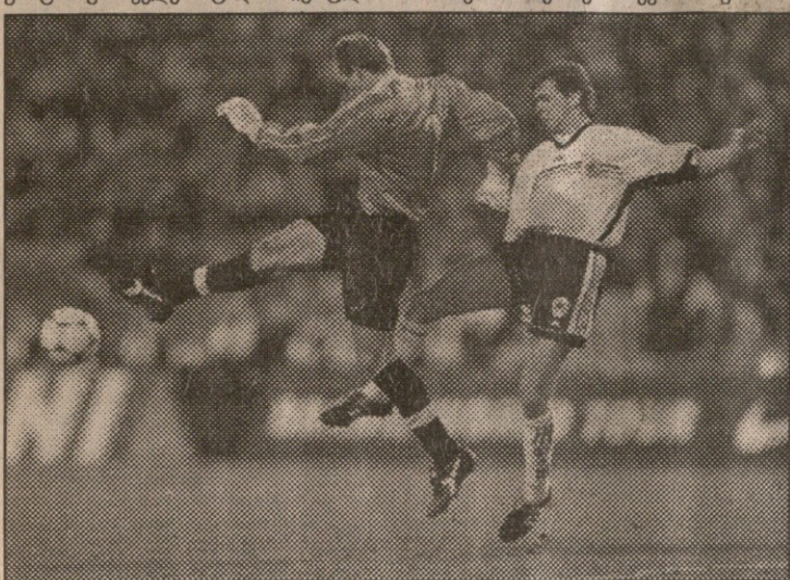
გერმანია — ბრავილია. მიოლერი და სხვა მასპინძლები ტაფარელს ხშირად აწუხებდნენ

ესპანეთი: სუბსარტეა, ფერერი, სერანი, ივან კამპო (როსი 76), ნადალი, იგრო (სანტი 46), ამორი, ლესი ვერაგო, მორინტესი (ალფონსო 46), რაული (კიკო 46), ფ. სანჩესი (ნებერია 60) შვედეთი: სვენსონი, ნილსონი, მ. ანდერსონი, ბიორკლენდი, სუნდგრენი (ლეკენი 70), შვარცი, ზეტერბერგი, ინგესონი, პეტერსონი (ბილდი 70), ლარსონი (ოსმანოვი 80), კ. ანდერსონი 1:0 2:0 მორინტესი (1, 5), 3:0 რაული (30), 4:0 ნებერია (70) საწყის ხუთ წუთში ყველაფერი ნათელი იყო — რეპუტაციაზე ფერანდო მორინტესმა ორი გოლი შეავალი. მორინტესის დარად ესპანელთა რიგებში პირველად ითამაშა ივან კამპომ, რომელიც ესპანეთის ფეხბურთის ის-