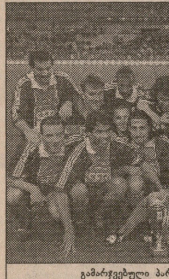
გამარჯვებული პარტიზლები ლიგის თასით