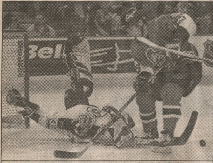
ოტავა — ბოსტონი. ოტაველი ბრუს გარდინერი ბოსტონის მეკარე რობი ტალასს მიუხედავად

შაიბები: ჰაინცე 19 (0:1), ჰაინცე 20 (0:2), ჰაინცე 21 (0:3), ფალუნი 8 (1:3), აკსელსონი 8 (1:4), ალფრედსონი 16 (2:4)