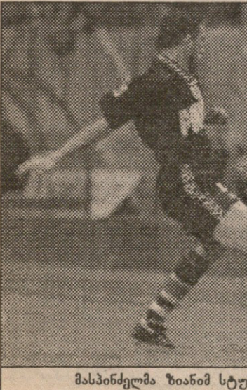
მასპინძელმა ზიანამ სტუმრებს დიდი ზიანი მიაყენა

— დღესაც მტკივნეულად განვიცდით ტურინში წაგებას. იტალიაში გაშვებული ოთხი ბურთიდან სამი (დელ პიეროს ორი პენალტი და ერთი ჯარიმა)