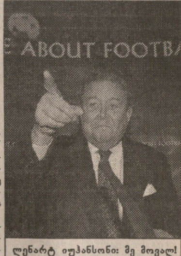
ლენარტ იუჰანსონი: მე მოვალ!

სამშაბათს, შუალაში, ვადა ამოიწურა. ახალი ვანაცხადი არავის შეუტანია. ამრიგად ფიფას პრეზიდენტობის კანდიდატურად იფიქრებს არა მხოლოდ ფიფას პრეზიდენტი ლენარტ იუჰანსონი და ფიფას ტენერალური მდივანი ზეგ ბოლტერი, არჩევენ, რომელიც 24 წლის მმართველობის შემდეგ თანამდებობიდან მიმავალი ბრაზილიელი ყოფილი აველანის შემცვლელს გამოავლენს 8 ივნისს, პარიზში, ფიფას 51-ე კონგრესზე გაიმართება. ეს მსოფლიოს ჩემპიონატის გახსნამდე ორი დღით ადრე მოხდება. პირველ რაუნდშივე გასამარჯვებლად კანდიდატურა ხმათა ორი მესამედი დასჭირდება. თუ ასეთი რაოდენობის მომხრე არცერთს აღმოჩნდება, გამარჯვებულს მეორე რაუნდში და უბრალო უმრავლესობის წესი გამოავლენს. არჩევნებში მონაწილეობას მიიღებს ფიფას წევრი 198 ასოციაცია. ნამდვილად ცნობილია ერთი ხმის მიმცემთა შორის არ იქნება არც, პალესტინის ფეხბურთის ასოციაცია, რომელსაც დროებით ასოციაციის სტატუსი აქვს. გარდა ამისა, შესაძლოა ხმის უფლებს ჩამოართვან იმ ასოციაციას (თუ ასეთი არსებობს), რომელსაც ყოველწლიური საწევრო არ აქვს გადახდილი ან 1994 წლის კონგრესის შემდეგ გამართულ ფიფას შეჯიბრებებიდან სულ მცირე ორში არ მიუღია მონაწილეობა.