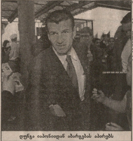
დუნგა იაპონიიდან აბარებებს აპირებს