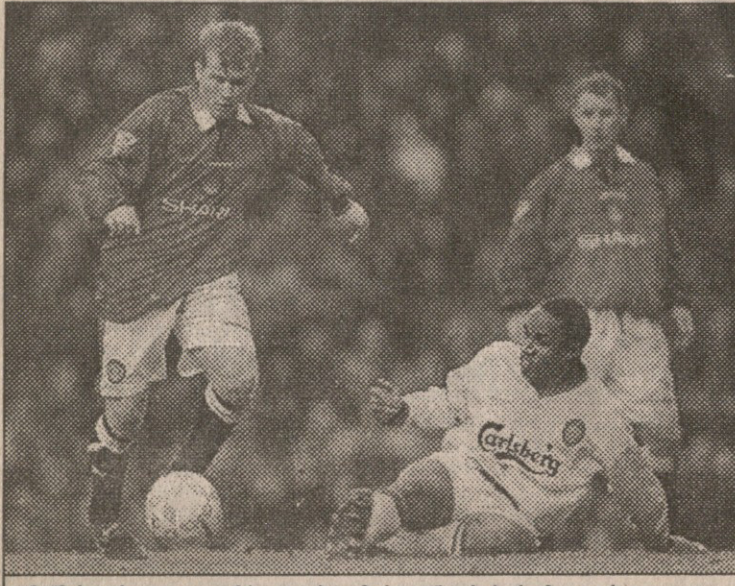
მანჩესტერი — ლივერპული. სტუმარი ინი სპორტზე ადრე დაეცა