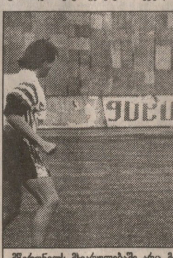
—მწვრთნელს შიარულევაში არც მოვარჯიშე ფეხბურთელები ჩამორჩნენ