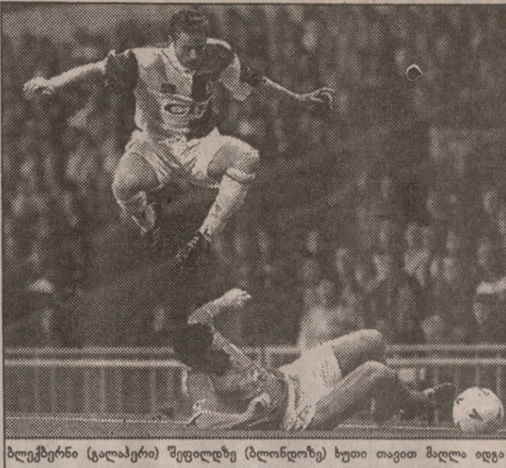
ბლეკბერნი (გალაპერი) შევიდრე (ბლონდოზე) ხუთი თავით მალა იდგა