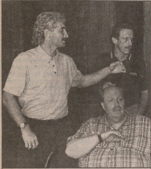
„ბაიერის“ ფიზიკურები ფილოლერი, კლემუნდი და დამუშ...