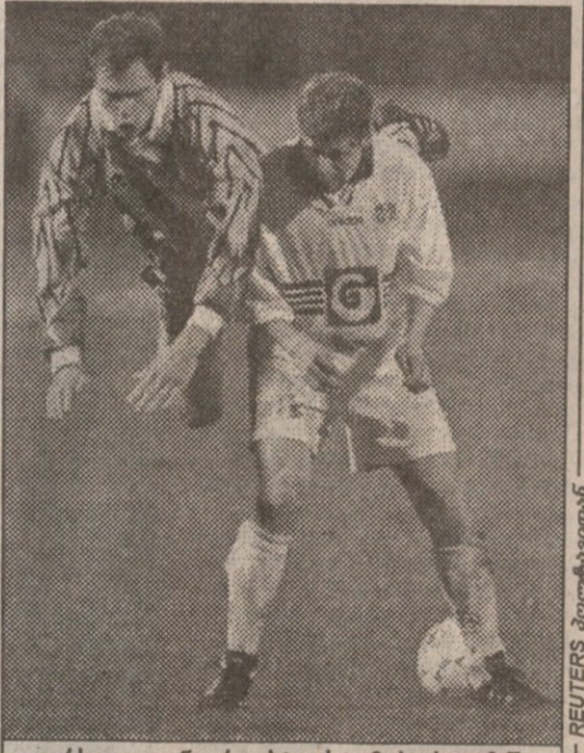
ვორსკლა — ანდრელეხტი. სტუმარი სელიმში გაოგნებულთა: სად ბურთი და სად ბაბიში

საპასუხო მატჩები. 26 აგვისტო ლიონი (საფრანგეთი) — მონპელიე (საფრანგეთი) 3:2 (1:0) მასტია (საფრანგეთი) — ჰალმშტადი (შვედეთი) 1:1 (1:0) ოსერი (საფრანგეთი) — დუისბურგი (გერმანია) 2:0 (0:0)