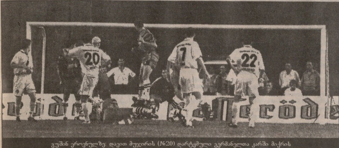
გუშინ ეროვნულზე: დავით მუჯირის (№20) დარტყმული გერმანელთა კარში მიქრის

საორტული გაზეთი გამოცემა 1990 წლის 28 დეკემბრიდან ხუთშაბათი, 28 აპრილი 1997 №100 (465) ფასი 40 თეთრი