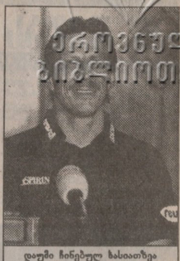
დალში ჩინებულ ხასიათზე