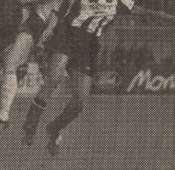
მონაკო — იუვენტუსი. ამერიკად ბარტევი ოთხის ნაცვლად მხოლოდ ორი გოლი გაუშვა

მეორე ტაიმი პირველი სეკან- დიდარ არ განსხვავდებოდა, თუმცა შესვენების შემდგომი თამაში უფრო დამაინტრიგებე- ლი იყო.