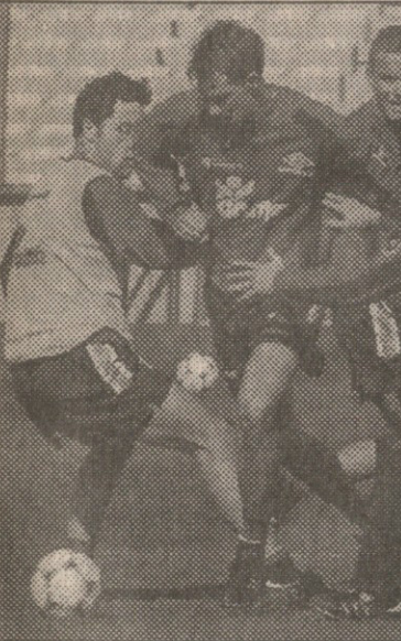
ნორვეგიელები გამარჯვების მოლოდინში...