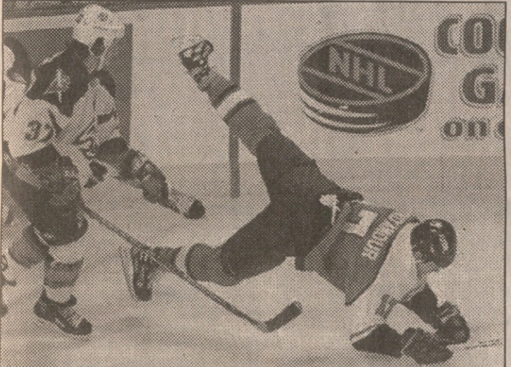
ფილაფელფიელ ბრინდამორს აკრობატული ნახტომი ნამდვილად არ უნდოდა

ბუფალი - ფილაფელფა 2:1 შაიბები: ლეკვერი 50 (0:1), ბრაუნი 12 (1:1), გროსეკი 10 (2:1)