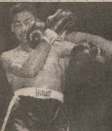
ასე უქნევდა თავის გრძელ მკლავებს ლუის: ოლიმპიური გმირი სკიტერ მაკკლური მედისონ სკვერში გაილახა

უკან მოსახეივც ჰქონდა: 121 ბრძოლა, აქედან 107 გამარჯვება, აქედან ნახევარზე მეტი ნოკაუტით. მაგრამ, იტყვიან კრივის მაჯანი ლირიკოსი, ეს მხოლოდ ის არის, რაც ნებისმიერ საკრივო ცნობარში წერია როდრიგესის გუარის გასწორებ და მეტი არაფერი. ჩვენც მანდა ვართ, სტატისტიკა საჭირო მცნობრება, მაგრამ კაცის ცხოვრებას ვერ აღწერს.