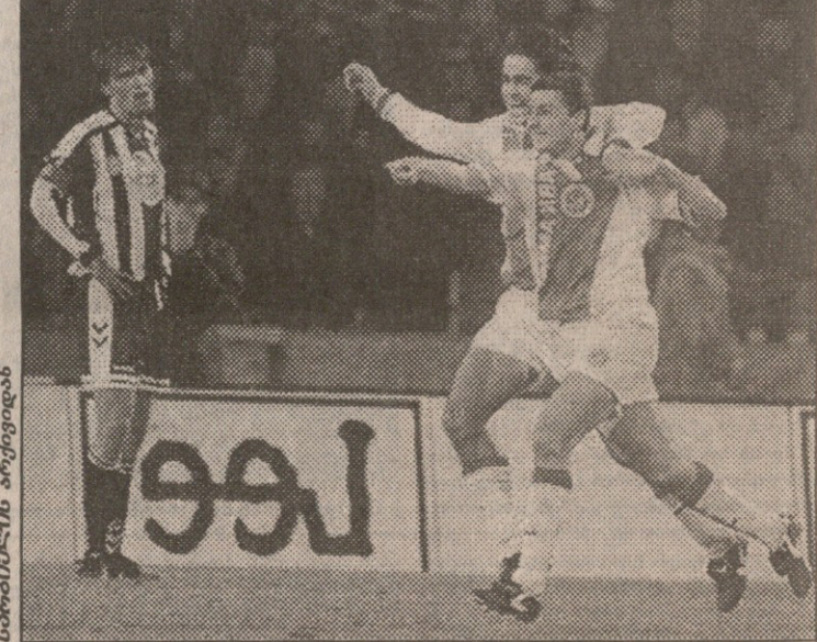
უდინელთა მკვლელები არველაძე და დანი იტალიელთა ძლევით ხართბენ

შოთამ საკუთარი აზრისაქართველოს ნაკრების საევროპისეგმიონატო მანსებზე და რუსეთთან მოახლოებულ ამხანაგურ მატჩზეც გამოთქვა. — ორივე წინასთან შედარებით იოლ ჯგუფში მოვხვდით, მაგრამ ბრძოლა აქაც დიდი მოკვლეობის საბერძნეთი და ლამის მთლად პრემიერლიგელი ფეხბურთელებით დაკომპლექტებული ნორვეგია საჩუქარი არაა, მაგრამ ჩვენ მაინც ყველა ღონეს უნდა მივმართოთ ჯგუფიდან გასასვლელად. რაც შეეხება რუსებთან მატჩს, დრო კი ცუდია შერჩეული — სეზონი დამთავრებულია, მაგრამ ამხანაგური მატჩები ისე გვაკლია, ყველანი დიდი სიამოვნებით ჩა-