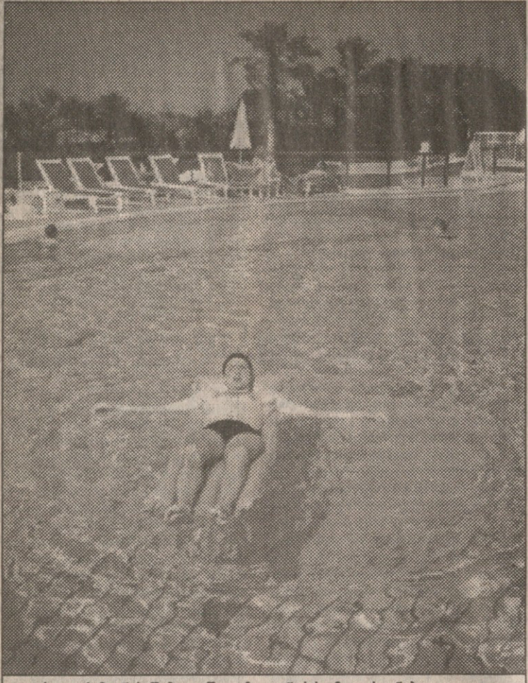
ასეთი სეზონის შემდეგ შოთაზე განცხრომა-დასვენება ალალია

ბავშვობაში ერთი ფოტო მქონდა, ალბათ ჟურნალიდან ამოჭრილი, რომელიც 1982 წლის საფეხბურთო სეზონის წინ ფრანგულმა კლუბმა „პარი სენ ჟერმენმა“ სრული შემადგენლობით გადაიღო. მასსოვს პირველ რიგში კმაყოფილი სახით იჯდა ფეხბურთელი, რომელიც საოცრად ჰგავდა დავით ყიფიანს. იმდენად ჰგავდა, რომ მე, იმთავითვე გარეწონისადმი მიდრეკილი, დაყინებით ვუსხინიდი ჩემს მეგობრებს, ეს უღვაწაშემევენებული კაცი ნამდვილად დავით ყიფიანა-მეთქი. სწორედ იმ დროს თბილისში ხშირად გაიგონებდით ხოლმე საუბარს რომელიმე ჩვენი სახელოვანი ფეხბურთელის საზღვარგარეთ, სახელოვან კლუბში მიწვევაზე და მიუხედავად იმისა, რომ ვიცოდი, ეს მხოლოდ ჩვენი ოცნება იყო და მას არსად გაუშვებდნენ ასე იოლად, ბოლოს თავად დავიჯერე, რომ იმ ფოტოდან სწორედ დავით ყიფიანი გვიდგმოდა. როგორც ჩანს, მართლა ძალიან გვინდოდა, რომ რომელიმე ქართველ ფეხბურთელს უცხოურ კლუბში, თუნდაც ცოტა ხნით გაეგრძეებინა და ჩემივე მოგონილი ტყუილი ამიტომაც დავიჯერე საიმოვნებით. ახლა კი, ამ ბავშვობის სუფიას იმიტომ ვიგონებ, რომ ჩვენ ცოტა უცნაურად, ერთგვარი სიმშვიდითა და თავისთავადობით მივიღეთ შოთა არველაძის ჩემპიონობა. შოთა არველაძე „აიაქსის“ შემადგენლობაში ჰოლანდიის ჩემპიონი გახდა და ჩვენთვის ეს უკვე ჩვეულებრივზე ჩვეულებრივი ამბავია. ეს არ გეიკირს და აღარც იმას ვიხსენებთ, რამდენიმე წლის წინ ვინმეს რომ ეთქვა ქართველი ფეხბურთელი „აიაქსის“ მი-