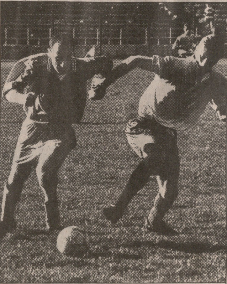
გუსლოკომოტიველი აწ რუსთაველი გამეცემლიმ ქვარცხავას გაურბის

გოლი მიიღო, რითაც ერთხელ კიდევ დაამტკიცა, მწვრთნელობა რომ კარგად ხელმძღვანელობს. გაიორ დარსაძეც კარგად და ჩახედული თავკაცობის საიდუმლოში, მაგრამ მის გუნდს რაღაც აქლია, ალბათ, შეთამაშება. ვეტერანთა და ახალგაზრდათა სრულფასოვან სინთეზს დრო სჭირდება, რომელიც დარსაძეს საკმარისი არ ჰქონდა. პოლა, ყველაფერი შედეგიდანაც ჩანს. შესვენების შემდეგ რკინიგზელები გაცილებით მწვავედ ათამაშდნენ. საკლდე მომენტებითაც მრავლად დაემუქრნენ რუსთაველებს, იმ მრავალთაგან კი ორი გოლი გარდასახეს. ვერც კაკუბავას კუთხურიდან ჩაწოდებული ამბიძემ თავით დაუდგო, აწ უკვე ყოფილ მერაბ ნედეგოვს გოლიც გაევიდა, ხუთივე წუთში გამეცემლიმ ლა-