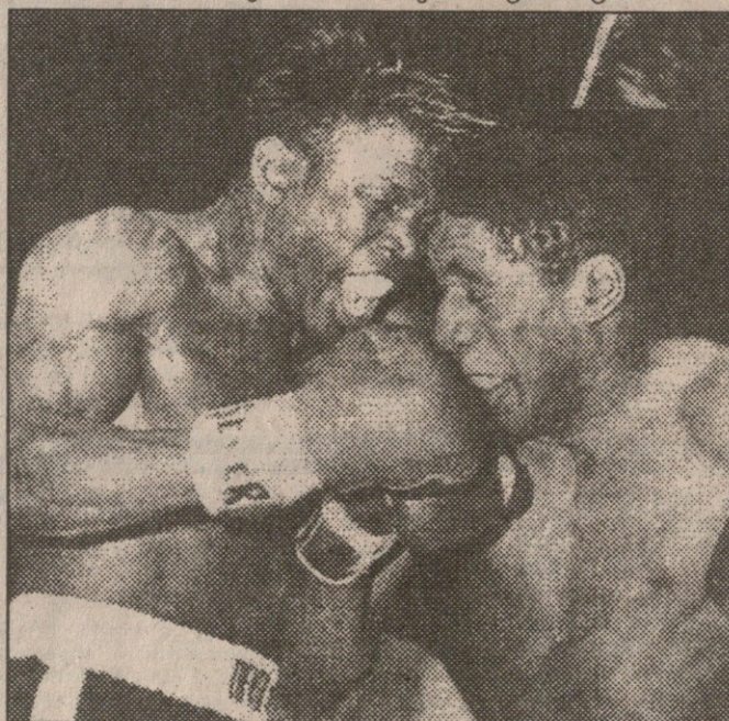
ეს ბრძოლა ემბლ გრიფიტის წინააღმდეგ ლუისმა ქულეებით მოიგო. თუმცა გრიფიტის მუშტი არაერთხელ მოხვდა ცხვირ-პირში