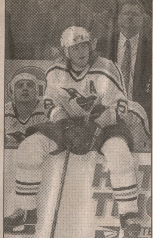
პიტსბურგელებს საპლეიფოდ, ცხადია, იართობი იაგრის იმედი აქვთ