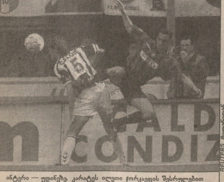
ინტერი — უილინგტონი. კარბონე იღვთი ჭოკაყვის შესრულებით