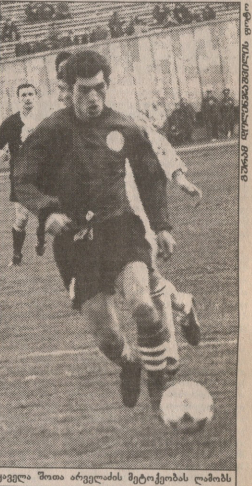
ყაველა შოთა არველაძის მეტოქეობას ლამობს

— არა, კომპლექტი. კუთხური მოაწოდა, მეტოქემ ბურთი საჯარიმიდან კი გაატანა, მაგრამ ისევე კომპლექტის დაუბრუნეს, მანაც იგივე გაიმეორა, მე მცველს და მეკარეს დაგასწარი, მაღლა აეხტი და მახვილი კუთხიდან შეეადგეთითქოს დაგვებედაო, ყოველ მატჩს ავდარში ვთამაშობთ, მთელი კვირა კარგი ამინდებია, პარასკევს კი გაწვიმდება და ორშაბათამდე არ გადაიღებს.