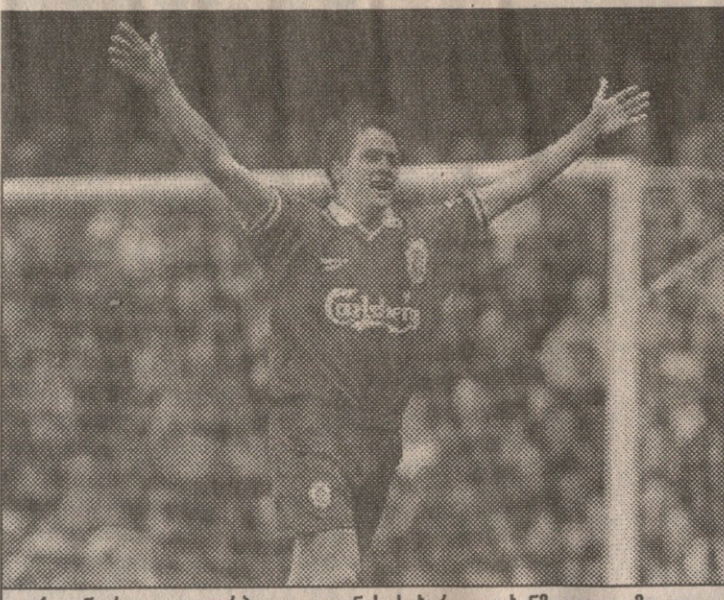
ქოვენიტი — ლივინგსტონი. თუნის სისარული ხანმოყვე გამოღდა

სენალი“ ყველაფრით აღებმებოდა „უემბლერსს“, უბრალოდ, დრო იყო იმისა, დედაქალაქურ დერბიში „მეფითებს“ ემარჯებოდა. 1988 წლიდან მოყოლებული, უიმბლერი „არსენალის“ მშობლიურ სარბიელ „ჰაიბერიჯზე“ ჩემპიონატში, შეხვედრა რაა, ის არ წაუვლიათ — ექვსჯერ მტოქენი ტოლ-სწორად და შორიდან ერთმანეთს, სამჯერაც ვიშემა უიმბლერივლად იმარჯვეს.