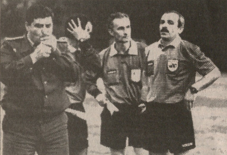
ხალხის დამოშინებამდე მსაჯებს მინდობდა მოუწიეთ ვურჯუბო