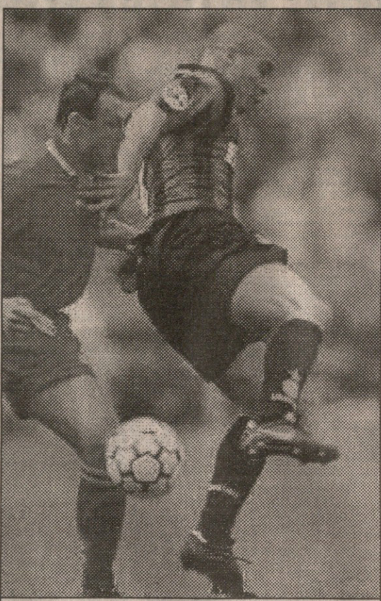
ინტერი — ბიანკინა. რონალდო ჰაჯიუი კია, მაგრამ მსტვან ვერზოვოდს ვერა დააკოო რა

ლმა, ვიცი-პრეზიდენტმა აღრიანო გალიანომ ასე უთხრა ურნალისტებს: — არავითარი კომენტარი. დავიცადოთ სეზონის ბოლომდე და ენახოთ... ჭორები კი ბუნებრივად ქუჩა-ქუჩა დაძვრებან. ისინი ქომაგებს ყურის ნიჟარზე ჩამოსხვებიან და ეწურჩელებიან, რომ მომავალ სეზონში კაპელოს ან ალბერტო ძავერონი შეცვლის ან კარლო ანჩლოტი ძავერონი „უდინეზეში“ მუშაობს, ანჩლოტი — „პარმაში“. უფრო სავარაუდო ძავერონისტი ჭორების ნაწარჩეული გახლავთ. საქმე ისაა, რომ ამ სეზონის ბოლოს „უდინეზედან“ „მილანში“ მიდის „სიბერეში“ სახელმძღვანელო გერმანული თავდასხმელი თავერე ბირპოფი და რაკი უდინე — მილანის ტრანსფერ-ბილიტი უკვე გააკალოლია, მას რაღა მოულოდნელი იმაში, რომ ფორვადს ჭკუის დამრიგებელიც გაძვევს? არაო, გიძახიან ანჩლოტისტი ჭორები. ჩვენი კარლო ფესვებით მილანელია, 1989, 1990 წლებში კლუბმა ჩემპიონთა თასი რომ მოიგო, მას შაე-ფითელი მისური ეცვა, თანაც „პარმასაც“ მისი გაძვევა უნდა, „ფიორენტი-დან“ ალბერტო მალესანის მიყვანას აპირებსო. — გაგზავნი. ძალიან გაგზავნი. ასე თამაში არ შეიძლება. „მილანში“ საკმაოდ არიან მაღალი კლასის ფეხბურ-