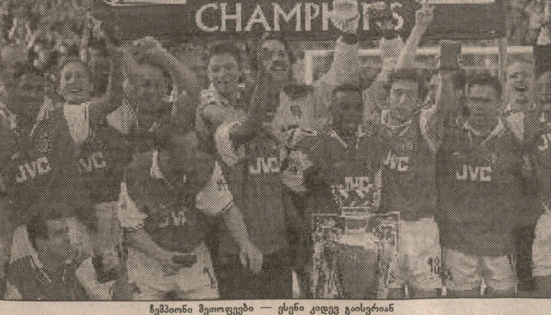
ჩემპიონი შეიგდებო — ესენი კიდევ გაისვრია