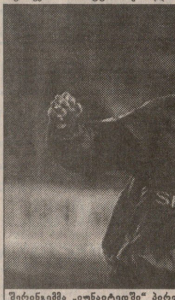
შერინგემში „იუნაიტედში“ პირველი გოლი იხემა, ბერესკამმა კი პირველი არსენალური ჰეთ-თრიქი