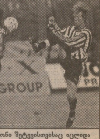
ზაგრებში ბარტონი შეტევისთვისაც იცლიდა

ყველაფერი ერთმა შეცდომამ გამოიწვია. ათ კაცამდე შეთხლებული ზაგრებელები, პენალტების მილოდინში. ბურთს თავისი საჯარიმოს მისაღობებთან ავორავებდნენ. სწორედ ის ბურთი დაეკარგათ და იგი ბეტიმ ჩაიგდო ხელთ. მან სწრაფად მოძებნა ასპირილია, კოლუმბიელმა კი საჯარიმოში ქეცაიას დასაბრუნებელი პოზიცია გამოიწვინა.