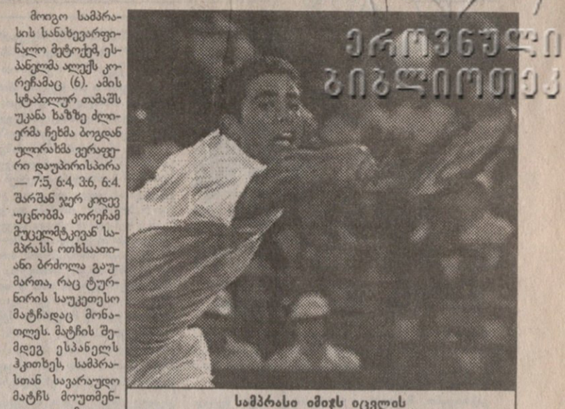
სამპრასი იმეხს იცვლის

პირველი წრის გაჯანჯლებული ხუთსეტანი თამაშის შემდეგ იოლად მოიგო სამპრასის პოტენციურმა მეტოქემ მეთექვსმეტი ნომერის ბრაზილიელმა გუსტავო კერტენმა (9). მისი მეტოქე წინა კვირის აშშ-ის ვაჟთა პროფესიული პირველობის გამარჯვებული, პოლანდელი შენგ სხალკენი იყო. თუმცა, 20 წლის ბრაზილიელს მისი ძლევა არ გასჭირვებია 6:4, 6:4, 6:2.