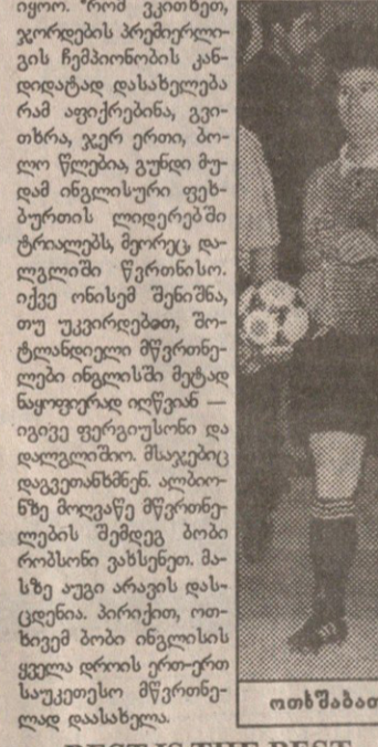
ოთხშაბათი. ინგლისელები საქმეს შეუდგნენ

მეორეხარისხი პრემიერლიგის უძლიერეს მწვერთელად ვის მიჩნევით, ვითხებით. მათ კი ვთქვამს, მსახივრობისთვის საჭიროა დადგენილი მსახივრობის დანსასახიანი მოსწონება. მსახივრობისთვის საჭიროა დადგენილი მსახივრობის დანსასახიანი მოსწონება.