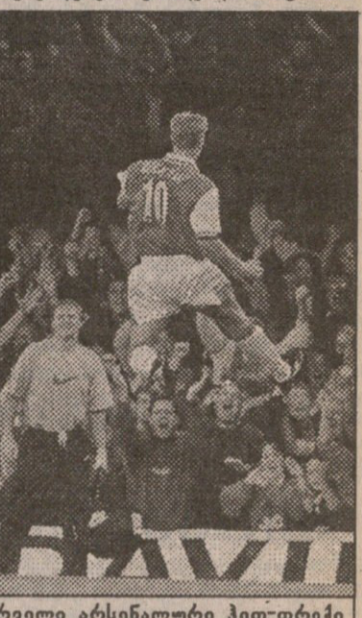
მომხმარებელი 1:1 ვისტ ჰემი