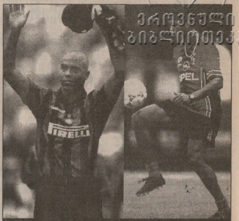
მილანიში დიდი ამბებია: აქვთ რონალდო „ინტერში“, იქით — კლუვიერტი „მილანიში“. ქალაქი ხარობს...