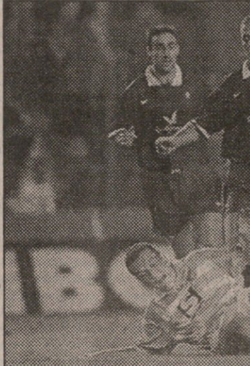
სტრასბური — რინჯერსი. პოლ გესქონის დენი კონტე ვიშება

„ლივერპულს“ კიდევ შეეძლო „სელტიკის“ მორალურად გატეხვა, მაგრამ რიდლემ ორივე გოლი ააგო და მიზანს დასწვინა. ბიჭები კი ამასობაში გონს მოიღონდნენ და ნელ-ნელა მოწინააღმდეგის საჯარიმო მოედანთან ხლავდნენ.