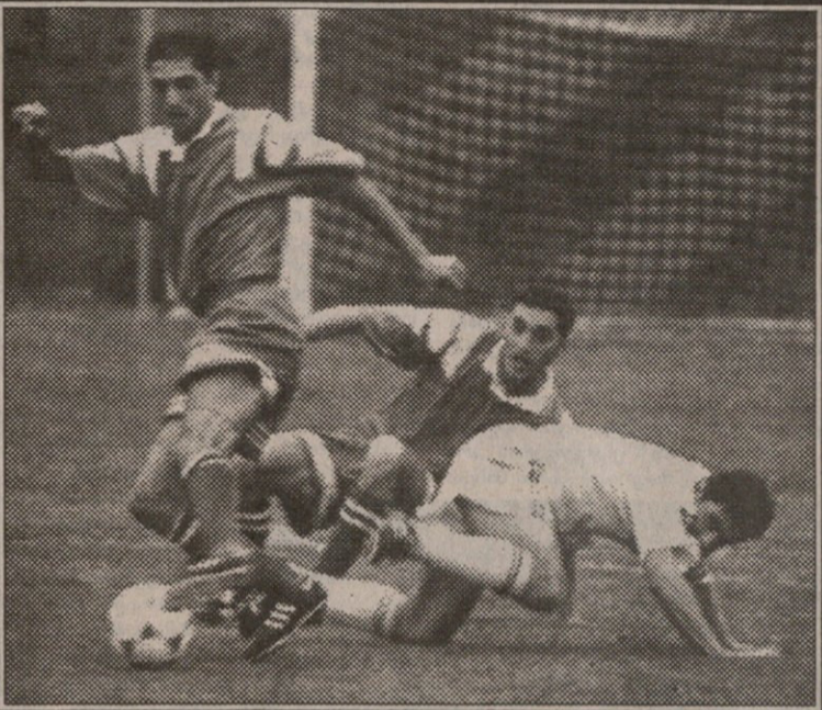
გუშინ მცხეთაში: თსუ — „მორკინალი“. დიდი ბრძოლა ქულისთვის

ბაკადონია — საქართველო 1:2 საქართველოს თერაპეუტ წლამდე ფეხბურთელთა ნაკრებმა გუშინ ვეროის ჩემპიონატის შესარჩევ მატჩში სტუმრად დაამარცხა მაკედონიის გუნდი. მიმდევრო შეხვედრას 2 ოქტომბერს კიბლეის ველოსიპედის ბიჭები რუმინეთში ჩატარებენ.