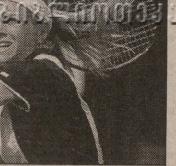
ჩინა ამანდას დიდი სენსაციაც კუტცერმა ჰინგისის მოუგო

მეორე ნრე: ნიკოლას კიფერი (გერმანია) — ტიმ პენანი (2 ინგლისი) 4:6, 7:6 (7:3), 6:2; ალექს რადულესკუ (გერმანია) — ფაბრის სანტორო (საფრანგეთი) 6:2, 6:3; მარკ ფილიპუსისი (3 ავსტრალია) — ლიონელ რუ (საფრანგეთი) 6:3, 6:7 (5:7), 6:3; ჯასტინ გამელსტობი (აშშ) — იან სიმერი (7 პოლანდია) 3:6, 7:6 (9:7), 6:0; არსო კლემანი (საფრანგეთი) — მაგნუს ლარსონი (5 შვედეთი) 7:6 (11:9), 3:6, 6:4.