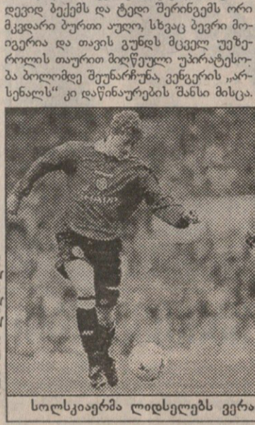
სოლსკიარმა ლიდსელებს ვერაფერი დააკლო